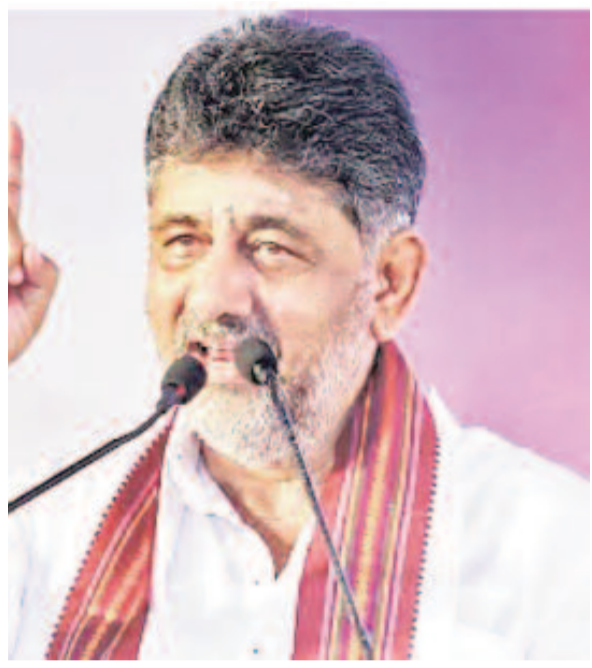
కర్ణాటక ఉప ముఖ్యమంత్రి, రాష్ట్ర కాంగ్రెస్ అధ్యక్షుడిగా ఉన్న 64 ఏండ్ల శివకుమార్ జూన్ 3న ముఖ్యమంత్రిగా బాధ్యతలు చేపట్టనున్నారు. కర్ణాటకలో మంత్రి పదవుల కోసం అప్పుడే పైకవీలు ప్రారంభమయ్యాయి. జూన్ 3న ప్రమాణ స్వీకారం చేయనున్న డిక్ తన క్యాబినెట్లో స్థానం కల్పించే మంత్రుల తుది జాబితా నిర్ధారణ కోసం కాంగ్రెస్ అధిష్ఠానాన్ని కలిసేందుకు ఢిల్లీ వెళ్లనున్నారు. మంత్రి పదవుల కోసం ఇప్పటికే పలువురు ఢిల్లీకి పయనమయ్యారు.

బెంగళూరు, మే 31: కొద్ది రోజుల్లో కర్ణాటక ముఖ్యమంత్రిగా బాధ్యతలు చేపట్టనున్న కాంగ్రెస్ నేత డిక్ శివకుమార్ దేశంలోనే అత్యంత సంపన్న సీఎంగా రికార్డు సృష్టించనున్నారు. 2023 ఎన్నికల సమయంలో సమర్పించిన అభివృద్ధి ప్రకారం ఆయన ప్రస్తుత ఆస్తుల విలువ రూ. 1400 కోట్లు కన్నా ఎక్కువే. ఇప్పటివరకు దేశంలో ధనిక సీఎంగా ఏపీకి చెందిన తెలుగు దేశం పార్టీ అధినేత చంద్రబాబు నాయుడు (రూ. 931 కోట్లు) ఉన్నారు. తర్వాతి స్థానంలో ఇటీవల తమిళనాడు సీఎంగా బాధ్యతలు చేపట్టిన విజయ్ (రూ. 624 కోట్లు) ఉన్నారు. వారిద్దరినీ వెనక్కి నెట్టి డిక్ ఇప్పుడు మొదటి స్థానాన్ని ఆక్రమించుకున్నారు.