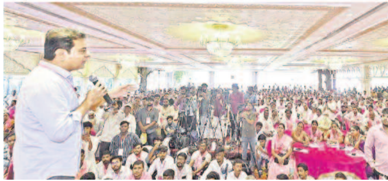
పోటీ చేస్తూ అని ప్రకటించాలి

● బీఆర్ఎస్ వర్కింగ్ ప్రెసిడెంట్ కేటీఆర్ సవారే