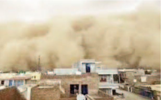
హైవేలపై మొత్తం చీకటి కమ్మేసింది. బికానర్ నగరం మొత్తం ఇసుక పొగతో నిండిపోయింది. దీంతో వాతావరణం రాకపోకలకు అటంకం ఏర్పడింది. స్థానికులు ఇళ్లు నుంచి బయటికి రాలేని పరిస్థితి నెలకొంది. ఇసుక దుమ్ముతో కూడిన గాలులు తీవ్రమవడంతో ఆ ప్రాంతంలో స్థానికులు భయంతో పడిపోయారు. ఇసుక తుఫాన్ , తీవ్రమైన గాలులతో నగరంలో సాధారణ జన జీవనం ఒక్కసారిగా స్తబ్ధించిపోయింది. కొన్ని ప్రాంతాల్లో విద్యుత్ సరఫరా కు నిలిచిపోయింది. షాపులు మూసివేసారు దుకాణదారులు. కొన్నిచోట్ల చెల్లు విరిగిపడ్డాయి.

తుఫాను ముగిసిన వెంటనే వాతావరణం చల్లబడింది. పలు జిల్లాల్లో ఇసుకమంటలు, మెరుపులతో కూడిన భారీ వర్షం కురిసింది. ఎండ వేడిమితో అల్లాడుతున్న ప్రజలకు ఈ వర్షం తాత్కాలిక ఉపశమనం కలిగించినప్పటికీ, అంతకుముందు సంభవించిన ఇసుక తుఫాను సృష్టించిన బీభత్సం వారినీ తీవ్ర ఇబ్బందులకు గురిచేసింది. అంతకుముందు శుక్రవారం కూడా రాజధాని జైపూర్ లో ఇలాంటి భీకర వాతావరణమే కనిపించింది. నిన్న ధోల్ పుర్ జిల్లాలో అత్యధికంగా 5.8 సెంటీమీటర్ల వర్షపాతం నమోదైంది. రాష్ట్రంలో మార్పులన్నీ ఈ వాతావరణ పరిస్థితులను భారత వాతావరణ శాఖ నిరంతరం పర్యవేక్షిస్తోంది. జైపూర్ లోని వాతావరణ కేంద్రం తెలిపిన వివరాల ప్రకారం.. రాజస్థాన్ లో ఈ తరహా ఇసుక తుఫానులు, ఈదురు గాలులతో కూడిన వాతావరణం మరో నాలుగైదు రోజుల పాటు కొనసాగి అవకాశం ఉంది. ప్రజలు అప్రమత్తంగా ఉండాలని అధికారులు సూచించారు. ఇసుక తుఫాన్ కారణంగా రోడ్లు, వీధులు,