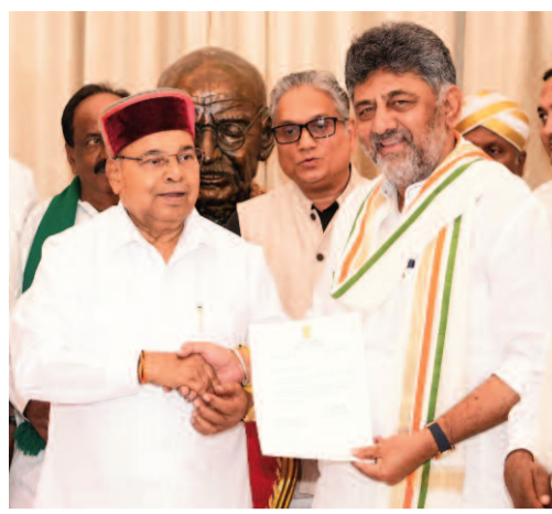
సపోర్ట్ కర్ణాటకలో కాంగ్రెస్ తిరిగి అధికారంలోకి వస్తుందని ఆయన ధీమా వ్యక్తం చేశారు. కాంగ్రెస్ అధిష్టానం ఆదేశాలతో సిద్ధరామయ్య ఈరోజు 28వ ముఖ్యమంత్రి పదవికి రాజీనామా చేసి డి.కె.ఎ.సి.ఎ. సీఎం పగ్గాలు చేపట్టేందుకు మార్గం సుగమం చేశారు. ప్రత్యామ్నాయ ఏర్పాట్లు జరిగింతవరకూ అవధ్యరహిత ముఖ్యమంత్రిగా కొనసాగాలని సిద్ధరామయ్యకు గవర్నర్ తాపరీచంద్ గెవ్లకర్ సూచించారు. కర్ణాటకలో కాంగ్రెస్ ప్రభుత్వం మూడేళ్ల పాలన పూర్తి చేసుకుంది. ఇదిలావుంటే అంతకుముందు కర్ణాటకలో నాయకత్వ మార్పు పక్రియలో కీలక పరిణామం చోటుచేసుకుంది. ఆ పార్టీ శాసనసభా పక్ష నేతగా డి.కె.ఎ.సి.ఎ. ఎన్నికయ్యారు. శనివారం సాయంత్రం

బెంగళూరు,మే30 : కర్ణాటక కాంగ్రెస్ లెజిస్లేటివ్ పార్టీ నేతగా ఎన్నికైన డి.కె.ఎ.సి.ఎ. జూన్ 3వ ముఖ్యమంత్రిగా ప్రమాణ స్వీకారం చేయనున్నారు. ఈ మేరకు ఆయన ప్రమాణ తీర్మానం అధికారికంగా ఖరారైంది. జూన్ 3వ కర్ణాటక సీఎంగా డి.కె.ఎ.సి.ఎ. ప్రమాణస్వీకారం చేస్తారని కాంగ్రెస్ ప్రధాన కార్యదర్శి కే.సి.వేణుగోపాల్ శనివారం సాయంత్రం ప్రకటించారు. సీఎల్పీ నేతగా డి.కె.ఎ.సి.ఎ. ఎన్నికైన అసంతరం మీడియాతో ఆ వివరాలను కే.సి.వేణుగోపాల్ పంచుకున్నారు. సీఎల్పీ నేతగా డి.కె.ఎ.సి.ఎ. ఎన్నికైనట్లు చెప్పారు. డి.కె.ఎ.సి.ఎ. సీఎంగా కాంగ్రెస్ సూచించగా, తొలుత సిద్ధరామయ్య, ఆ తర్వాత పరమేశ్వర ఆయన పేరును సీఎల్పీ సమావేశంలో ప్రతిపాదించారని, ఏకగ్రీవంగా దీనికి ఎమ్మెల్యేలు అమోదం తెలిపారని వివరించారు. ముఖ్యమంత్రి మార్పు కాంగ్రెస్ పార్టీకి సమస్య అవుతుందని అంతా భావించారనీ, అయితే తమదంతా ఒక కుటుంబమని, అంతా ఏకగ్రీవంగా ఈ ఎన్నికను అమోదించడం పార్టీకి గర్వకారణమని అన్నారు. 2028లోనూ నాయకులందరికీ