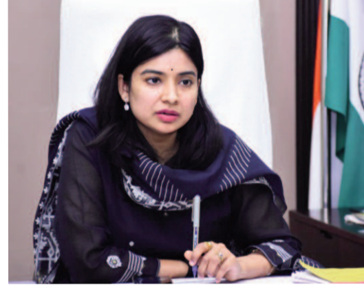
విజయవంతం చేయాలని ఆదేశించారు.

జిల్లా వ్యాప్తంగా సోమవారం మొత్తం 2750 ఇందిరమ్మ ఇండ్లను గృహ ప్రవేశాలు చేసేందుకు ఏర్పాట్లు చేస్తున్నామని పేర్కొన్నారు. సోమవారం సామూహిక గృహప్రవేశాల కార్యక్రమం అన్ని మండలాలు, గ్రామాల్లో పండుగ వాతావరణంలో నిర్వహించేందుకు అన్ని ఏర్పాట్లు చేయాలని, సంబంధిత మండల ప్రత్యేక అధికారి అధ్యక్షత తీసుకుని కార్యక్రమాలు సజావుగా, ప్రశాంత వాతావరణంలో నిర్వహించేలా చూడాలని ఆదేశించారు. అన్ని ఇండ్లను పూలతో ముస్తాబు చేసి ప్రారంభానికి సిద్ధం చేయాలని అన్నారు. ప్రజాపాలన - ప్రగతి ప్రణాళిక 99 రోజుల కార్య చరణలో భాగంగా వన మహోత్సవం సందర్భంగా మొక్కలు నాటాలని సూచించారు. ఇందిరమ్మ ఇండ్ల ప్రారంభోత్సవాల్లో ప్రజాప్రతినిధులను, ఇందిరమ్మ కమిటీ సభ్యులను భాగస్వామ్యం చేయాలని అన్నారు. అందరికీ ముందుగానే సమాచారం అందించాలని సూచించారు. సమన్వయంతో పని చేసి సామూహిక ఇందిరమ్మ ఇండ్ల ప్రారంభోత్సవాల కార్యక్రమాన్ని విజయవంతం చేయాలని ఆదేశించారు.