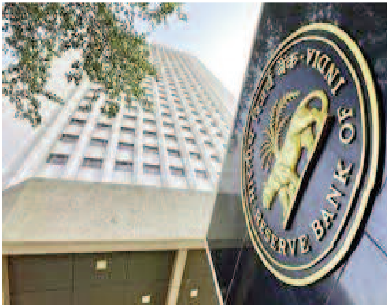
అంతకుముందు 1,17,722 గుర్తింపగా, నకిలీ చలామణి కూడా బాగా పెరిగిందని ఆ తర్వాత ఆ సంఖ్య 1,41,907కి చేరింది. నివేదిక తెలిపింది. ఏడాది క్రితం 253 నోట్లు అలాగే రూ.20 ముఖ విలువ ఉండే నోట్లు బయటపడగా అవి 47.4శాతం పెరిగి 373కి

ముంబయి,మే30 : దేశంలో నకిలీ నోట్ల అంతకంతకూ పెరిగిపోతున్నాయి. దర్యాప్తు అధికారుల సోదాల్లో పెద్ద మొత్తంలో నకిలీ కరెన్సీ పట్టుబడుతుండటమే ఇందుకు నిదర్శనం. బ్యాంకింగ్ వ్యవస్థలో నకిలీ కరెన్సీ నోట్ల గుర్తింపు 2025-26లో 5.7 శాతం పెరిగిందని భారత రిజర్వ్ బ్యాంక్ వెల్లడించింది. దీనికి అనుబంధం లేదా కరెన్సీ రహిత ప్రవాహం పెరగాలని సూచిస్తున్నాయి. నోట్ల రద్దు చేసినా నకిలీ నోట్ల ముద్రణ అగడం లేదని తెలుస్తోంది. ప్రధానంగా ముఖ విలువ రూ.200, రూ.500 ఉన్న నోట్ల ఇందులో ఎక్కువగా వుంటున్నాయని తెలిపింది. 2025-26లో మొత్తంగా నకిలీ నోట్ల సంఖ్య 2,29,746కి పెరిగిందని, అంతకుముందు ఆర్థిక సంవత్సరంలో ఈ సంఖ్య 2,17,396గా వుందని ఆర్ బి ఐ తన వార్షిక నివేదికలో పేర్కొంది. 2024-25లో నకిలీ రూ.500 నోట్ల 20.5 శాతం పెరిగాయి.