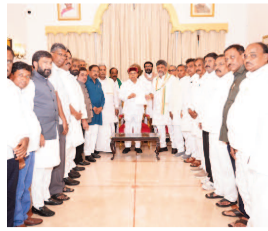
విధాన సభలో జరిగిన సీఎల్పీ సమావేశంలో ఆ పార్టీ ఎమ్మెల్యేలు డి.కె.ఎ.సి.ఎ. ఏకగ్రీవంగా ఎన్నికయ్యారు. ఆ పార్టీ వర్గాలు వెల్లడించాయి. శివకుమార్ పేరును మాజీ సీఎం సిద్ధరామయ్య ప్రతిపాదించగా సీనియర్ నేత పరమేశ్వర బలపరిచినట్లు తెలిసింది. మరోవైపు జూన్ 3వ నూతన ముఖ్యమంత్రిగా డి.కె.ఎ.సి.ఎ. ప్రమాణస్వీకారం చేయనున్నట్లు కర్ణాటక కాంగ్రెస్ ఇప్పటికే ప్రకటించింది. ఇందుకోసం బెంగళూరులోని లోక్ సభలో గౌ. హోస్లో ఏర్పాట్లు కూడా చేస్తున్నట్లు తెలిసింది. తాజాగా సీఎల్పీ నేతగా ఎన్నికైన డి.కె.ఎ.సి.ఎ. గవర్నర్ ను కలిసి ప్రభుత్వం ఏర్పాటుకు తనను అభ్యర్థించాలని కోరుతున్నారు. పరిశీలకులుగా కెసి వేణుగోపాల్, జైరాం రమేష్ హాజరయ్యారు.