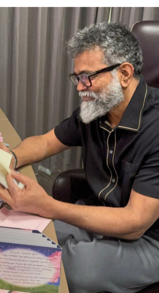
ప్రస్తుతం రామ్ చరణ్ - సుకుమార్ సినిమా ఇంకా స్క్రిప్ట్ దశలోనే ఉందని సమాచారం. కథ పూర్తిగా సిద్ధం కాకముందే సంగీత దర్శకుడిని ఫైనల్ చేసే పరిస్థితి లేదని తెలుస్తోంది.