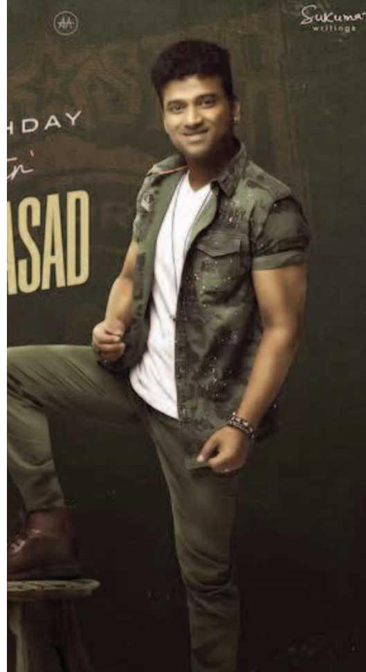
టాలీవుడ్ దర్శకుడు సుకుమార్- సంగీత దర్శకుడు దేవి శ్రీ ప్రసాద్ కాంచినేషన్కు ఉన్న క్రేజ్ గురించి ప్రత్యేకంగా చెప్పాల్సిన పనిలేదు. 'అదృశ్య'తో మొదలైన వీరి ప్రయాణం 'రంగస్థలం', 'పుష్ప'