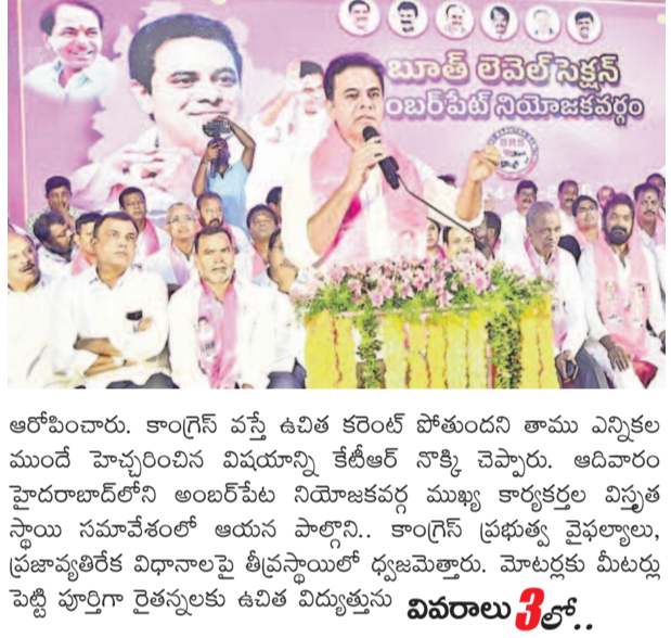
ఆరోపించారు. కాంగ్రెస్ వస్తే ఉచిత కరెంట్ పోతుందని తాము ఎన్నికల ముందే హెచ్చరించిన విషయాన్ని కేటీఆర్ నాక్కి చెప్పారు. ఆదివారం హైదరాబాద్ లోని అంబర్పేట నియోజకవర్గ ముఖ్య కార్యకర్తల విస్తృత స్థాయి సమావేశంలో ఆయన పాల్గొని.. కాంగ్రెస్ ప్రభుత్వ వైఫల్యాలు, ప్రజావ్యతిరేక విధానాలపై తీవ్రస్థాయిలో ధ్వజమెత్తారు. మోటార్లకు మీటర్లు పెట్టి పూర్తిగా రైతులకు ఉచిత విద్యుత్తును వివరాలు 3లో..