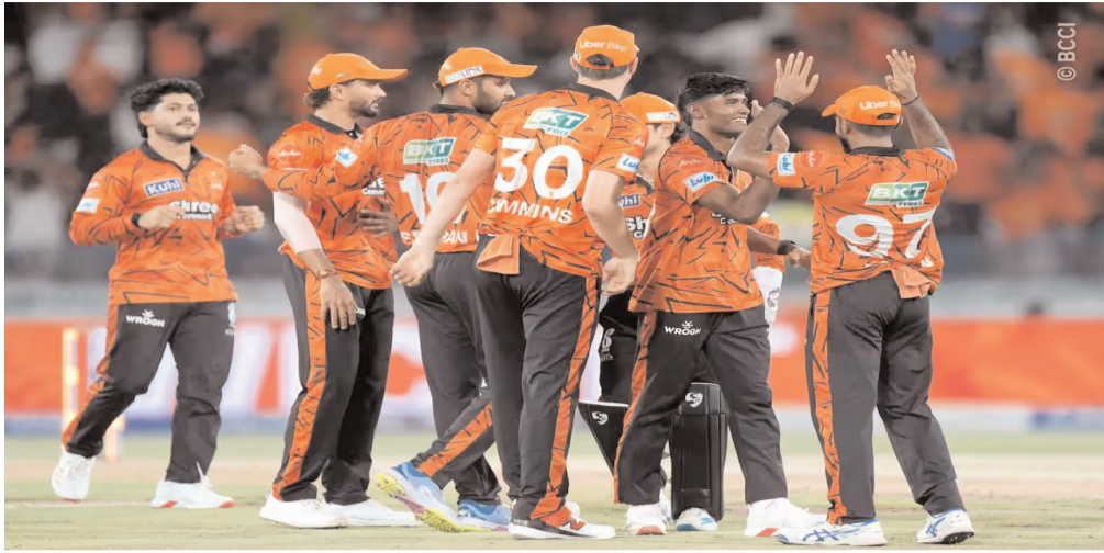
నాటౌట్ సిక్సర్లతో రెచ్చిపోవడంతో హైదరాబాద్ ప్రత్యర్థి ముందు 256 పరుగుల భారీ లక్ష్యాన్ని నిర్దేశించింది.

ఉప్పరిశ్రమ వేదికగా జరిగిన ఈ మ్యాచ్లో టాప్ ఓడ మొదట బ్యాటింగ్కు దిగిన హైదరాబాద్ టాపర్ల విద్యుంసం సృష్టించింది. ఓపెనర్ అభిషేక్ శర్మ (56) మెరుపు అరంభాన్ని ఇవ్వగా, ఆ తర్వాత ఇషాన్ కిషన్ (79), హెలీన్ క్లౌన్ (51) టోపీ ఆర్మీ బౌలర్ల భరతం పట్టింది. వీధిదూర శతక భాగస్వామ్యంతో స్కోరు బోర్డును పరుగులు పెట్టించారు. డెట్ ఓవర్లలో నిట్టి రెడ్డి (29