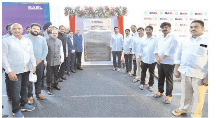
ఉద్యోగాలు, కొత్త అవకాశాలు: ఇంత తక్కువ సమయంలో, రికార్డు కాలంలో ప్రాజెక్టును పూర్తి చేసిన 'ఎస్ఎకెఎల్ ఇండియా' బ్యూడానికి ముఖ్యమంత్రి తన హృదయపూర్వక అభినందనలు తెలియజేశారు. ఈ మోగా సౌర విద్యుత్ కేంద్రం ద్వారా రాయలసీమ ప్రాంత ప్రజలకు పెద్ద ఎత్తున ఉద్యోగ ఉపాధి అవకాశాలు లభిస్తాయని, ఈ ప్రాజెక్టు ప్రాంతీయ అభివృద్ధికి, కొత్త పెట్టుబడులకు బాటలు వేస్తుందని చంద్రబాబు ఆశాభావం వ్యక్తం చేశారు.

సుస్థిర భవిష్యత్తుకు నిదర్శనం: ముఖ్యమంత్రి ఈ మోగా సోలార్ ప్రాజెక్టు విజయవంతంగా ప్రారంభం కావడంపై ముఖ్యమంత్రి నారా చంద్రబాబు నాయుడు సోషల్ మీడియా వేదికగా స్పందిస్తూ హర్షం వ్యక్తం చేశారు. "వ్యాపార నిర్వహణ వేగం (స్పీడ్ ఆఫ్ డూయింగ్ బిజినెస్), కార్యనిర్వహణ వేగం (స్పీడ్ ఆఫ్ ఎగ్జిక్యూషన్) రెండూ కలిసిన ప్రదేశం ఆంధ్రప్రదేశ్ అని చెప్పడానికి నేను ఎంతో గర్వపడుతున్నాను" అని సీఎం పేర్కొన్నారు. రాయలసీమ ప్రాంతంలో 'సుఖ్ బీర్ ఆగ్రి ఎనర్జీ' సంస్థ నిర్మించిన ఈ 600 మోగావాట్ల సోలార్ ప్రాజెక్టు రాష్ట్ర సుస్థిర భవిష్యత్తు పట్ల తమ ప్రభుత్వానికి ఉన్న తిరుగులేని నిబద్ధతకు నిదర్శనమని చంద్రబాబు స్పష్టం చేశారు. భారతదేశ స్వచ్ఛ ఇంధన ప్రయాణంలో ఆంధ్రప్రదేశ్ ను ఆగ్రామీణ నిలబడుతున్న ఇలాంటి ప్రాజెక్టులు రాష్ట్రానికి ఎంతో గర్వకారణమని ఆయన కొనియాడారు.