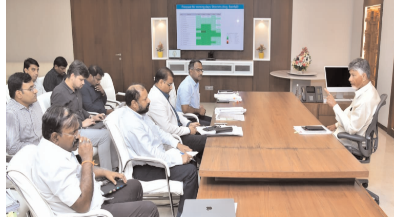
జిల్లా కలెక్టర్ల ప్రత్యేకంగా మీడియా సమావేశాలు నిర్వహించి ప్రజలను చైతన్యపరచాలని నిర్దేశించారు.

వేసవి నేపథ్యంలో గ్రామీణ, పట్టణ ప్రాంతాల్లో ఎక్కడా తాగునీటి సరఫరాకు అంతరాయం కలగకుండా చూడాలిని పూర్తి బాధ్యత అధికారులపైనే ఉందని ముఖ్యమంత్రి హెచ్చరించారు. ఎండల తీవ్రత దృష్ట్యా ప్రజలు తీసుకోవాల్సిన జాగ్రత్తలపై విస్తృతంగా అవగాహన కల్పించాలని, ఇందుకోసం