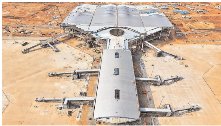
అక్కడి నుంచే విమాన సర్వీసుల రాకపోకలు బలగం డీవీ, అమరావతి

జూలై 8వ తేదీ నుంచి భోగాపురంలోని అల్లూరి సీతారామరాజు విమానాశ్రయం అందుబాటులోకి రానుంది. జూలై 5వ తేదీన ప్రధాని నరేంద్ర మోదీ భోగాపురం విమానాశ్రయాన్ని ప్రారంభించే అవకాశం ఉంది. జూలై 8వ తేదీ నుంచి తమ విమానాల్ని భోగాపురం నుంచే నడుస్తాయని పలు విమానయాన సంస్థలు ఇప్పటికే ప్రకటించాయి. జూలై 8వ తేదీ నుంచి అల్లూరి సీతారామరాజు విమానాశ్రయానికి రావాలని ఇప్పటికే తమ ప్రయాణికలకు సర్దుబాటు జారీ చేశాయి. 2026 జూలై 8వ తేదీ నుంచి సూట్ ఎయిర్లైన్లకు సంబంధించిన అన్ని విమానాలు విశాఖపట్నం విమానాశ్రయం నుంచి కాకుండా.. కొత్తగా నిర్మించిన అల్లూరి సీతారామరాజు అంతర్జాతీయ విమానాశ్రయం నుంచి నడుస్తాయని సూట్ ఎయిర్లైన్ల సర్దుబాటు జారీ చేసింది. విమానాశ్రయం మారినప్పటికీ, ఎయిర్పోర్ట్ కోడ్ క్విజ్ గానే కొనసాగుతుందని తెలిపింది. చెక్-ఇన్ కౌంటర్లు, సూట్ ఎయిర్లైన్ల కౌంటర్లు కొత్త విమానాశ్రయంలోని టెర్మినల్ 1 లోపల ఉంటాయని విమానయాన సంస్థ వెల్లడించింది. విమానం బయలుదేరే సమయానికి 2.5 గంటల (150 నిమిషాలు) ముందే చెక్-ఇన్ కౌంటర్లు తెరవబడతాయని తెలిపింది. అల్లూరి సీతారామరాజు అంతర్జాతీయ విమానాశ్రయం (భోగాపురం) విశాఖపట్నం నుండి సెంటర్ నుంచి సుమారు 50 కిలోమీటర్ల దూరంలో ఉంది. ప్రయాణికులు ఎలాంటి ఆలస్యం లేకుండా చెక్-ఇన్ వ్యవస్థలను పూర్తి చేసుకోవడానికి.. విమానం టైం కంట్రీ కనీసం 120 నిమిషాల ముందే ఎయిర్పోర్ట్ కు చేరుకోవాలని సూట్ ఎయిర్ లైన్ల సంస్థ సూచించింది.