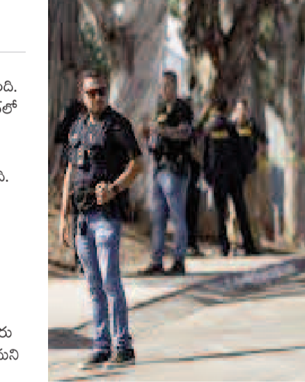
17, 19 సంవత్సరాల మధ్య ఉండొచ్చని అధికారులు పేర్కొన్నారు. మృతులలో ఒకరు ఇస్లామిక్ సెంటర్ లో భద్రతా సిబ్బందిగా పనిచేస్తున్నారని, ఆయన సమయానికి