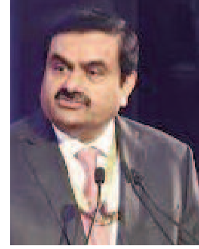
పరిష్కరించబడింది. ఈ ఒప్పందం 275

వసూలు చేశారని ఆదానీపై అమెరికాలో కేసులు నమోదయ్యాయి. అమెరికాలో ఇటువంటి ఆరోపణలను పూర్తిగా కొట్టివేయడం ఒక అసాధారణ చర్య అని న్యాయ విపుణులు అభిప్రాయపడుతున్నారు. ఎస్ ఈ సి దాఖలు చేసిన కేసును పరిష్కరించుకోవడానికి ఆదానీ 6 మిలియన్ డాలర్లు చెల్లించడానికి అంగీకరించినట్లు కోర్టు పత్రాలు చూపిస్తున్నాయి. సాగర్ ఆదానీ కూడా 12 మిలియన్ డాలర్లు చెల్లించడానికి అంగీకరించారు. తండ్రిపేజీ దిగుమతులకు సంబంధించి ఇరాన్ పై అమెరికా విధించిన అంక్షలను ఆదానీ గ్రూప్ ఉల్లంఘించిందని ఆరోపిస్తూ యూఎస్ బ్రెజిల్ డిపార్ట్ మెంట్ యొక్క ఆఫీస్ అఫ్ ఫైనాన్స్ అండ్ సెక్యూరిటీ కంట్రోల్ (ఎఫ్ డి సి) దాఖలు చేసిన కేసు కూడా