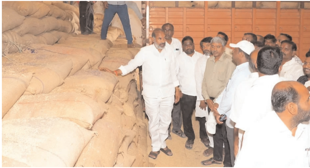
బలగం టీవీ, వేములవాడ: