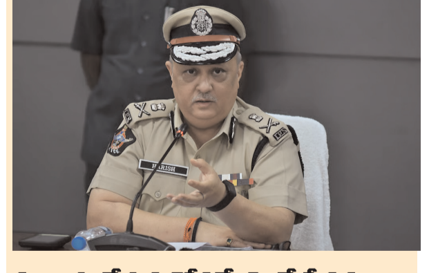
ఏపీ సముద్ర తీర ప్రాంత భద్రతపై అధికారులు అప్రమత్తంగా ఉండాలని ఆంధ్రప్రదేశ్ ముఖ్యమంత్రి నారా చంద్రబాబు నాయుడు ఆదేశించారు.

గచ్చిబౌలి స్టేడియం వేదికగా నిర్వహించిన యూత్ అండ్ స్పోర్ట్స్ డే-2026 కార్యక్రమంలో పద్మభూషణ్ పురస్కార గ్రహీత పుల్లెల గోపీచంద్ ఫిజికల్ లిటరసీ' అంశంపై ప్రత్యేక ఉపన్యాసం ఇచ్చారు. తెలంగాణ క్రీడాశాఖ అధ్యక్షులతో ప్రజా పాలన ప్రగతి ప్రణాళిక 99 రోజుల కార్యక్రమంలో భాగంగా మే 18 నుంచి 23 వరకు ఈ కార్యక్రమాలు నిర్వహిస్తున్నారు. యువత సాధికారత, ఫిజికల్ నెరోత్వాహం ప్రధాన లక్ష్యాలుగా ఈ వేడుకల కోసంసాగుతున్నాయి. ఈ సందర్భంగా గోపీచంద్ మాట్లాడుతూ, శారీరక సాక్షరత ప్రాధాన్యత కేవలం క్రీడాకారులకు మాత్రమే కాకుండా సమాజంలోని ప్రతి వర్గానికి తెలియజేయాలి అవసరం ఉందన్నారు. యువతలో ఆరోగ్యకర జీవనశైలి, క్రమశిక్షణ, మానసిక దృఢత్వం, క్రీడాస్ఫూర్తి పెంపొందించడంలో ఫిజికల్ లిటరసీ కీలక పాత్ర పోషిస్తుందని వివరించారు. క్రీడాకారంగం దేశానికి కీర్తి ప్రతిష్ఠలు తీసుకువచ్చే ముఖ్యమైన రంగాల్లో ముందుంటుందని, ఆరోగ్యవంతులైన సమాజం అన్ని రంగాల్లో సమగ్ర అభివృద్ధికి దోహదం చేస్తుందని అభిప్రాయపడ్డారు. కార్యక్రమంలో డా. ఎ. సోనిదాసా దేవి మాట్లాడుతూ, రాష్ట్రంలో క్రీడా మౌలిక సదుపాయాలు అభివృద్ధి, గ్రామీణ స్థాయిలో క్రీడల ప్రోత్సాహంపై ప్రభుత్వం ప్రత్యేక దృష్టి పెట్టిందన్నారు. యూత్ అండ్ స్పోర్ట్స్ డే-2026 ద్వారా శారీరక ఆరోగ్యంపై అవగాహన పెంపొందించడం, క్రీడలో సామాజిక భాగస్వామ్యాన్ని విస్తరించడం, రాష్ట్రంలోని ప్రతిభావంతులైన క్రీడాకారులను గుర్తించడం లక్ష్యమని తెలిపారు. కార్యక్రమంలో స్పోర్ట్స్ అధికారి డి.పూర్ణి రెడ్డి, రవిశేఖ, గచ్చిబౌలి స్టేడియం అధ్యక్షులు ఖిల్జీ దండయాత్రకు ఈ అలయం ద్వారం చేశారు. తదనంతరం దీనిని సర్దాగ మార్గారు.