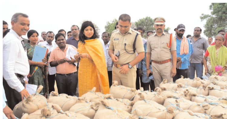
బలగం డి.పీ, ఇల్లంతకుంట: కొనుగోలు కేంద్రాల నుంచి ధాన్యం తరలింపేందుకు ట్రాన్స్పోర్ట్ కాంట్రాక్టర్లు లారీల సంఖ్యను