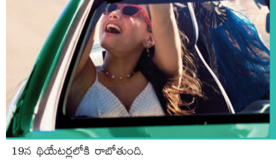
19న థియేటర్లలోకి రాబోతుంది.

మ్యూజికల్ ఈవెంట్ను నిర్వహించింది చిత్రబృందం. రష్మిక మాట్లాడుతూ.. 'కాక్టెయిల్ 2' చాలా భిన్నమైన చిత్రం. మీ ఊహకు కూడా అందదు. ముఖ్యంగా ఈ సినిమాలో కృతి అద్భుతంగా నటించింది. మాకు, షాహిద్ కు మధ్య కెమిస్ట్రీ మరో స్థాయిలో ఉంటుంది. ఈ భిన్నమైన ప్రేమకథను అందరూ ఎంజాయ్ చేస్తారు. ఇప్పటి వరకూ మీరు చూసింది చాలా తక్కువ. ముందు ముందు మరివి సర్ప్రైజ్లు ఉన్నాయి. వాటిని చూడడం కోసం నేను కూడా ఉత్సాహంగా ఎదురుచూస్తున్నా' అని చెప్పుకొచ్చింది. మదకా ఫిల్మ్స్ నిర్మిస్తున్న ఈ చిత్రం జూన్