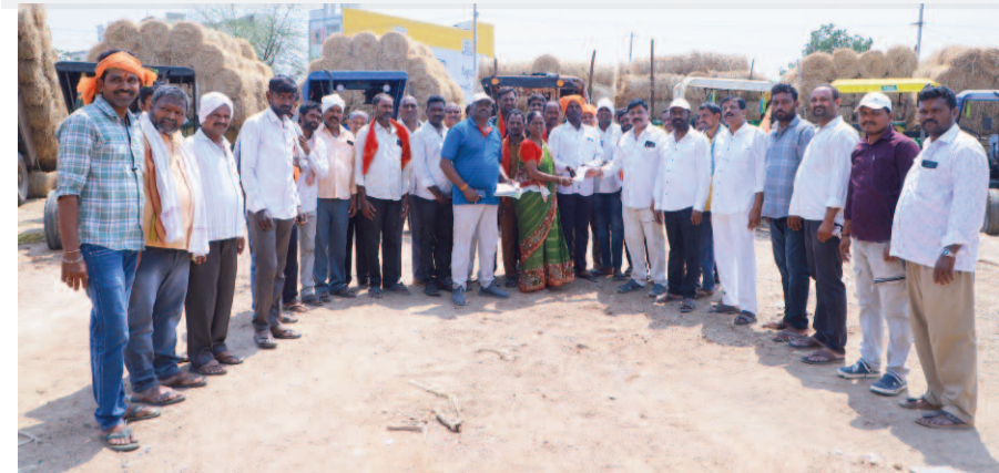
-విదేశీగా నిరంతరాయంగా రైతు సేవలు

జలగం టీవీ, రాజన్న సిరిసిల్ల : జనమీవాని ప్రత్యేక దర్శనం కల్పించి, అనంతరం స్వామివారి ప్రసాదాన్ని అందజేసినారు. దేవస్థానం పరిధిలోని తిప్పాపురం గోశాలకు పెద్దపెల్లె జిల్లాకు చెందిన రైతులు మరియు జానకిరామ్ ట్రాక్టర్ ఓనర్ డ్రైవర్ అసోసియేషన్ సభ్యులు భారీగా ఎండు గడ్డిని విరాళంగా అందజేశారు. కనుకల, మారుతినగర్, రామనిపల్లి, తొగర్రాయి ప్రాంతాలకు చెందిన భక్తులు ఈ సేవకు విరాళం 65 ట్రాక్టర్ల ఎండు గడ్డిని సమర్పించారు. మొదట్లో కేవలం 10 ట్రాక్టర్ల గడ్డితో ప్రారంభమైన ఈ సేవా కార్యక్రమం, నిరంతరంగా సాగుతూ గత ఏడాది 45 ట్రాక్టర్లకు చేరుకుంది. ఈ ఏడాది ఏకంగా 65 ట్రాక్టర్ల ఎండు గడ్డిని విరాళంగా అందజేసి తమ సేవా గుణాన్ని చాటుకున్నారు. రైతులు సేకరించిన ఈ విరాళాన్ని దేవస్థానం డి.కే.ఓ.