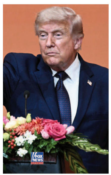
రు. చైనా పర్యటన అనంతరం ట్రంప్ ఈ వ్యాఖ్యలు చేయడం ప్రాధాన్యం సంతరించు కుం

వాషింగ్టన్, మే 17 : తైవాన్ అంశంపై అమెరికా అధ్యక్షుడు డొనాల్డ్ ట్రంప్ కీలక వ్యాఖ్యలు చేశారు. అది తమకు కష్టమైన సమస్యని వెల్లడించారు. భౌగోళికంగా ఆ ప్రాంతం తమకు చాలా దూరంలో ఉందని వ్యాఖ్యానించారు. తైవాన్ అంశం క్లిష్టమైన సమస్య. ఈ ద్వీపం.. చైనాకు కేవలం 95 కిలోమీటర్ల దూరంలో ఉందని, అమెరికాకు మాత్రం 15 వేల కి.మీ.కు పైగా దూరంలో ఉంది. సుదూర ప్రాంతం కారణంగా మేం వేగంగా స్పందించడం కష్టమే. చైనా చాలా శక్తిమంతమైన, పెద్ద దేశం కూడా. ఉద్రిక్తతల విషయంలో చైనా, తైవాన్ లు సందర్భంలో పాటింపాలి అని ఓ వార్తాసంస్థతో మాట్లాడుతూ ట్రంప్ చెప్పారు. వారి స్వాతంత్ర్య ఆకాంక్షల కోసం అంతదూరం ప్రయాణించి మేం యుద్ధం చేయాలని అనుకోవడం లేదన్నా