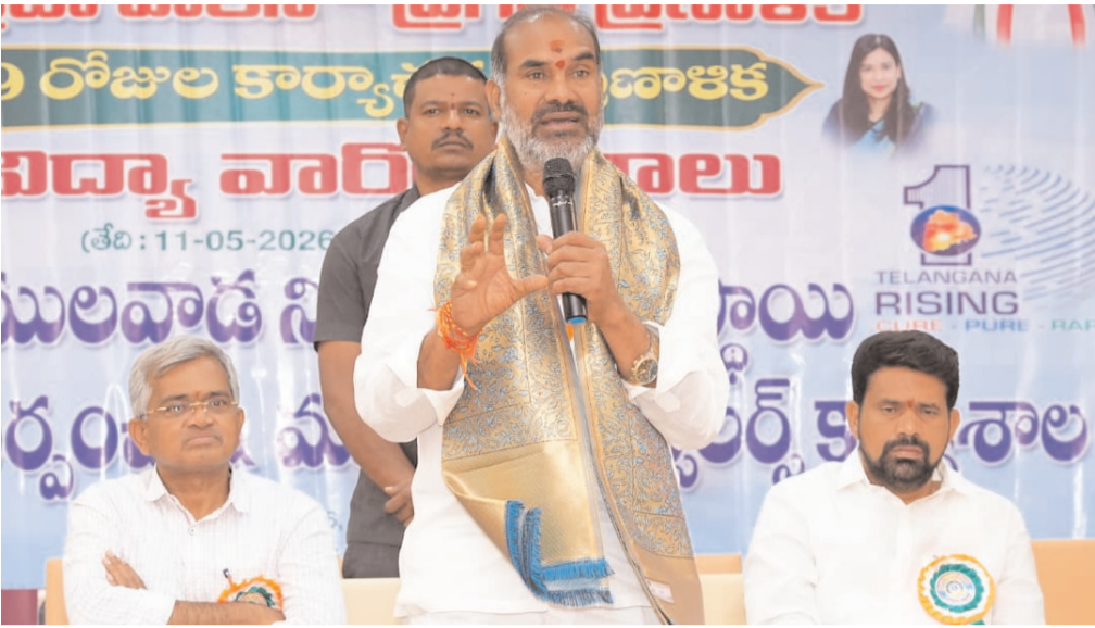
బలగం డీపీ, రాజన్న సిరిసిల్ల

తెలంగాణ పేద విద్యార్థులకు అంతర్జాతీయ స్థాయి విద్యను చేరువ చేస్తూ, కార్పొరేట్ విద్యార్థులకు డీటుగా రాష్ట్ర ప్రభుత్వం తెలంగాణ వజ్రక్ సూల్స్ తీర్చిదిద్దడందని రాష్ట్ర ప్రభుత్వం ప్రకటించింది. తెలంగాణ వజ్రక్ సూల్స్ అధికారి అన్నారు.