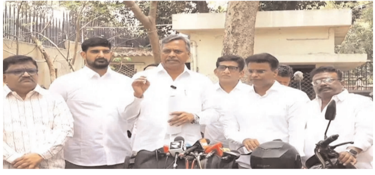
బలగం డీపీ, హైదరాబాద్