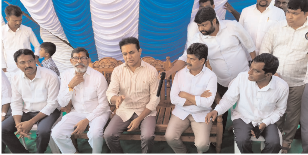
బలగం డీపీ, రాజన్న సిరిసిల్ల :

రాష్ట్రంలో కాంగ్రెస్ ప్రభుత్వం అధికారంలోకి వచ్చిన నాటి నుండి ప్రజలకు కష్టాలు మొదలయ్యాయి. దేశమంతా కాంగ్రెస్ను వదిలివేయాలంటే తెలంగాణ ప్రజలు మాత్రం ఆ పార్టీని నెత్తిన పెట్టుకుని మోసపోయారని బీఆర్ఎస్ వర్గాల ప్రతిపక్షం అన్నారు. రాజన్న సిరిసిల్ల జిల్లా వీరపల్లి మండల కేంద్రంలో ఏర్పాటుచేసిన విలేజ్ కలెక్షన్ సమావేశంలో బీఆర్ఎస్ వర్గాల