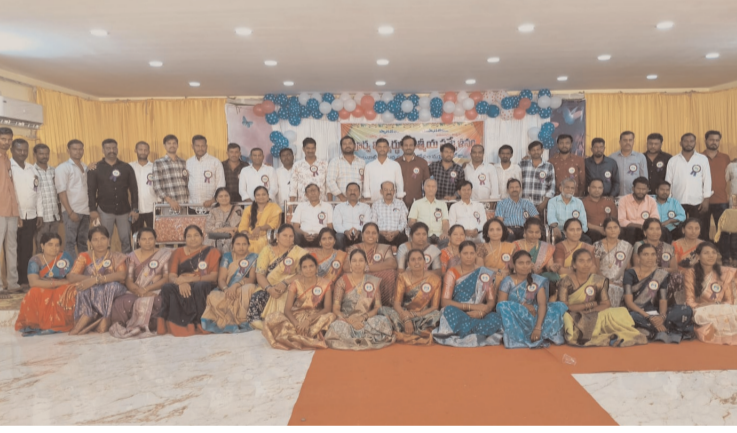
తెలిపారు. ఈ కలయిక కేవలం పలకరింపులకే పరిమితం కాకుండా, చిన్ననాటి మిత్రుల మధ్య బంధాన్ని మరింత బలోపేతం చేసేదని ఆనందం వ్యక్తం చేశారు.

సరిగ్గా 21 ఏళ్ల త్రితం ఒకే తరగతి గదిలో పాఠాలు విని, భవిష్యత్తు కలలతో విడిపోయిన ఆ నేస్తాలూ మళ్లీ ఒకేచోట చేరి పాత జ్ఞాపకాలను నెమరువేసుకున్నారు. రాజన్న సిరిసిల్ల జిల్లా బోయినిపల్లి మండల కేంద్రంలోని జిల్లా పరిషత్ ఉన్నత పాఠశాలలో 2004-2005 విద్యా సంవత్సరంలో పదవ తరగతి చదివిన పూర్వ విద్యార్థుల ఆత్మీయ సమ్మేళనం ఆదివారం అత్యంత కోలాహలంగా జరిగింది. చదువు పూర్తిచేసి విడిపోయిన వీరంతా, మళ్లీ తాము ఎక్కడైతే విడిపోయాలో అక్కడే కలుసుకోవాలని నిర్ణయించుకోవడం విశేషం. ? పూర్వ విద్యార్థి కన్వెన్షన్ సాగే అధ్యక్షులలో జరిగిన ఈ కార్యక్రమంలో విద్యార్థులు తమ చిన్ననాటి స్నేహితులను చూసి భావోద్వేగానికి లోనయ్యారు. రెండు దశాబ్దాల సుదీర్ఘ విరామం కావడంతో ఒకరినొకరు "నన్ను గుర్తుపట్టావా?" అని అప్యాయంగా పలకరించుకుంటూ అలింగనం చేసుకున్నారు. వయసు రీత్యా వచ్చిన మార్పులను పక్కన పెట్టి, పాఠశాల రోజుల్లో తాము చేసిన అల్లరిని, పాత జ్ఞాపకాలను గుర్తు చేసుకుంటూ సంతోషంతో మునిగిపోయారు. తమ ప్రస్తుత ఉద్యోగ బాధ్యతలు, కుటుంబ వివరాలను ఒకరితో ఒకరు పంచుకుంటూ గడిపారు. ? తమను ఉన్నత శిఖరాలకు చేర్చిన గురువులను విద్యార్థులు మర్చిపోలేదు. ఈ ఆత్మీయ సమ్మేళనానికి తమకు విద్య నేర్పిన ఉపాధ్యాయులను సాధరంగా ఆహ్వానించారు. వారి ఆశీస్సులు తీసుకుని, గురువులను ఘనంగా సన్మానించి మెమెంటోలను అందజేశారు.