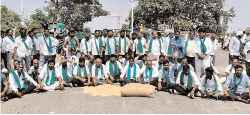
జిల్లాలో వడ్ల కొనుగోళ్ల జాప్యంపై భగ్గుమన్న రైతులు, బీఆర్ఎస్ నేతలు.. బలగం టీవీ, రాజన్న సిరిసిల్ల:

ప్రభుత్వం వెంటనే స్పందించాలని డిమాండ్ చేశారు. రైతులు మాట్లాడుతూ, ఇసుక తరలింపుకు వందల లాభిలు అందుతుంటే వస్తున్నప్పటికీ, వడ్ల తరలింపుకు మాత్రం లాభిలు రాకపోవడం అన్యాయమని మండిపడ్డారు. ప్రభుత్వం వీటన్నింటికీ తీవ్ర వ్యతిరేకతను వ్యక్తం చేస్తూ, రైతుల సమస్యలను పట్టించుకునే తీరిక లేకపోవడంపై ప్రశ్నించారు.