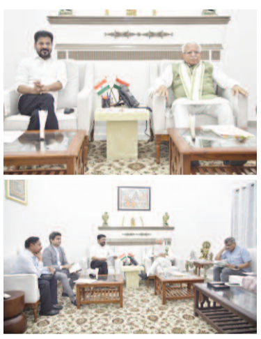
అంకాలపై చర్చించారు. మెట్రో రెండ్ దశకు అవసరమైంది మిగతా 3లో..