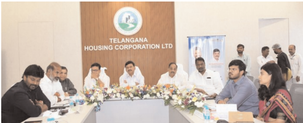
బలగం టీవీ, హైదరాబాద్: