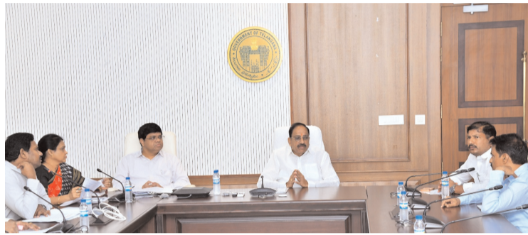
రాకుండా సరిహద్దుల్లో కట్టుబట్టమైన భద్రత ఏర్పాటు చేయాలన్నారు.

కో-మార్కెటింగ్ విధానంలో కంపెనీలు తమ లోపాలను కష్టపెట్టుకుంటూ రైతులను మళ్ళిపెట్టడాన్ని ప్రభుత్వం సహించదని మంత్రి హెచ్చరించారు. దీనిపై నిర్దిష్ట నియమావళిని రూపొందించాలని, అవసరమైతే కో-మార్కెటింగ్ విధానాన్ని పూర్తిగా రద్దు చేసే అంశాన్ని పరిశీలించాలని అధికారులను ఆదేశించారు. అలాగే, హెచ్.టి. (య) పత్తి విత్తనాలు రాష్ట్రంలోకి