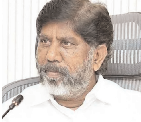
కాకుండా, పెండింగ్లో ఉన్న కారుణ్య నియామకాలను భర్తీ చేసి కార్మిక బిడ్డలకు ఉపాధి కల్పించామని వివరించారు. ఇంధన శాఖ

కార్మిక లోకానికి ఉపముఖ్యమంత్రి భట్టి విక్రమార్కు మల్లు 'మే దే' సందర్భంగా శుభాకాంక్షలు తెలియజేశారు. ఇందిరమ్మ రాజ్యంలో కార్మికుల శ్రేయస్సుకే ప్రథమ ప్రాధాన్యత ఉంటుందని, ప్రజా ప్రభుత్వం అధికారంలోకి వచ్చిన తర్వాత కాలంలోనే క్రమిక వర్గం కోసం చారిత్రాత్మక నిర్ణయాలు తీసుకుందని ఆయన కొనియాడారు. ముఖ్యంగా సింగరేణి చరిత్రలో నిలిచిపోయేలా కార్మికులకు రూ. 1 కోటి ప్రమాద బీమా సౌకర్యాన్ని కల్పించామని, అలాగే సహజ మరణం పొందిన కార్మికుల కుటుంబాలకు రూ. 10 లక్షల ఆర్థిక సాయం అందజేస్తూ కొండత అండగా నిలుస్తున్నామని భట్టి విక్రమార్కు పేర్కొన్నారు. గనుల్లో ప్రాణాలకు తెగించి పనిచేసే కాంట్రాక్టు కార్మికుల కష్టాన్ని గుర్తించి, సంస్థ చరిత్రలోనే తొలిసారిగా వారికి రూ. 5 వేల బోనస్ అందించడమే