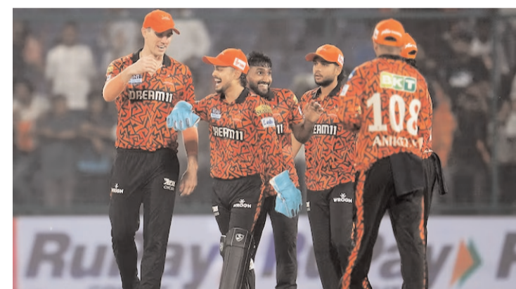
బలగం టీవీ, హైదరాబాద్