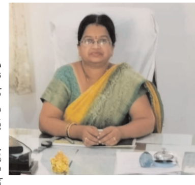
లారీలను ఏర్పాటు చేయాలన్నారు. ధాన్యం లోడింగ్, ఆన్ లోడింగ్ ప్రక్రియలు సజావుగా