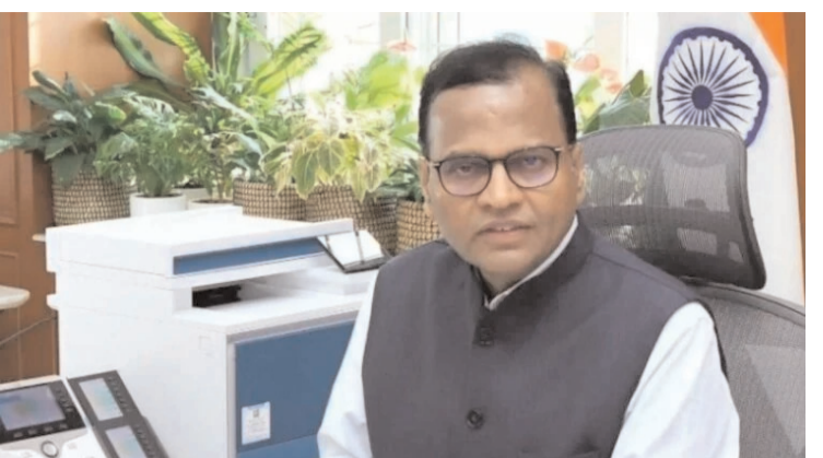
అదేవిధంగా జిల్లాల్లో కొనసాగుతున్న ధాన్యం కొనుగోళ్లకు కూడా జిల్లా కలెక్టర్లతో టెలికాన్సల్టేషన్ ద్వారా సమావేశించారు. గౌరవ ముఖ్యమంత్రి ఆదేశాల మేరకు ధాన్యం కొనుగోళ్లలో ఎక్కడ జాప్యం లేకుండా, రైతులకు ఎలాంటి ఇబ్బందులు లేకుండా తగు చర్యలు తీసుకోవాలని జిల్లా కలెక్టర్లను ఆదేశించారు.