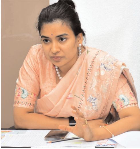
లారీలను ఏర్పాటు చేయాలన్నారు. ధాన్యం లోడింగ్, ఆన్ లోడింగ్ ప్రక్రియలు సజావుగా