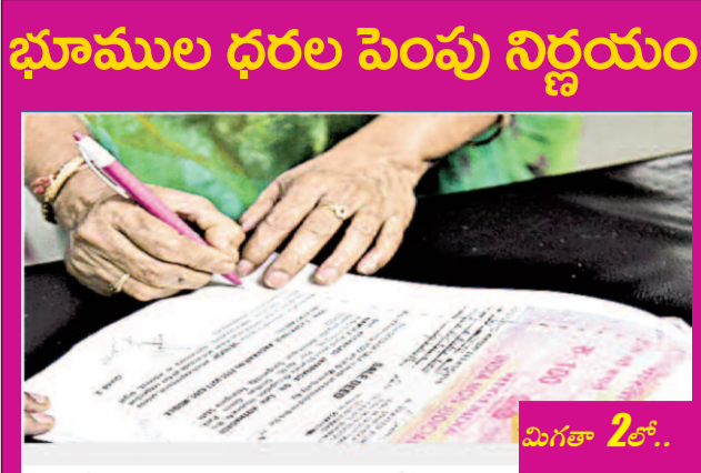
భూముల ధరల పెంపు నిర్ణయం