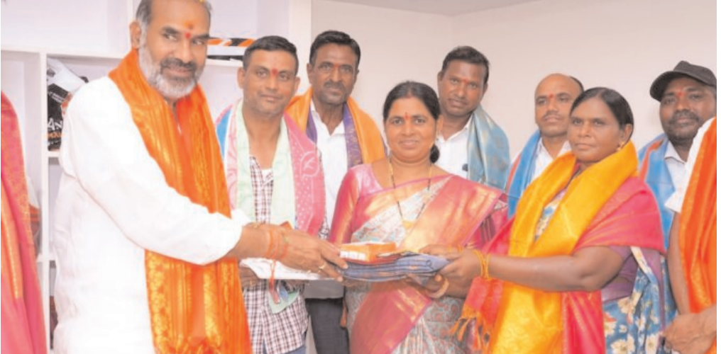
మంజూరు చేసినందుకు కృషి చేస్తామని హామీ ఇచ్చారు. ఈ గృహ ప్రవేశ వేడుకల్లో స్థానిక ప్రజాప్రతినిధులు, మండల అధికారులు, కాంగ్రెస్ పార్టీ నాయకులు మరియు గ్రామస్థులు పెద్ద సంఖ్యలో పాల్గొన్నారు.