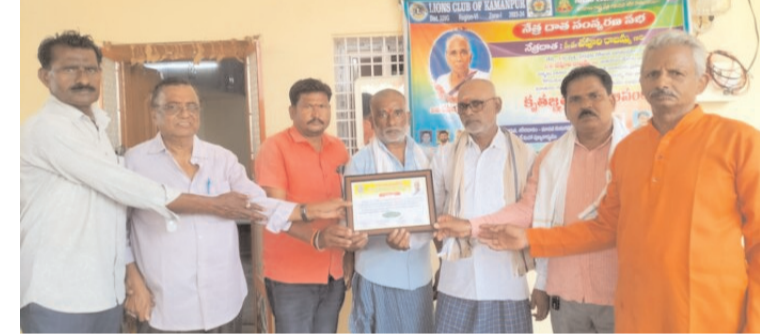
నేత్ర, అవయవ, దేహ దానం మానవ జన్మకు మహా పుణ్య కార్యం..