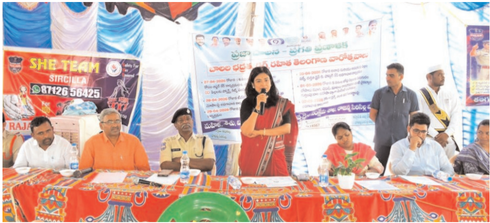
బలగం టీవీ, రాజన్న సిరిసిల్ల: