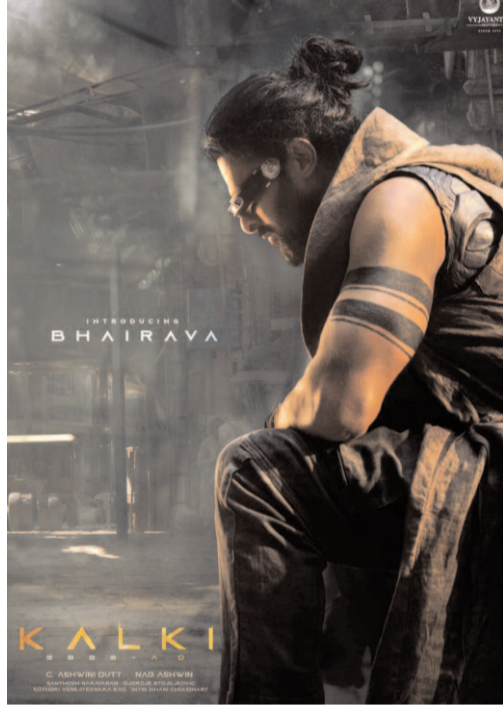
తమిళ నటుడు శింబు కూడా చేరినట్లు ప్రచారం

క్లింబిన 'కల్కి' చిత్రం బాక్సాఫీస్ వద్ద సంచలన విజయాన్ని సాధించి చెన్నై వెళ్ళు కోట్లకు పైగా వసూళ్ళు సాధించింది. పూర్ణా ఆధారంగా భవిష్యత్ నేపథ్యంలో సాగిన ఈ సినిమా ప్రేక్షకులను వివరీతంగా ఆకట్టుకుంది. ఇప్పుడు ఈ చిత్రానికి సీక్వెల్ గా 'కల్కి 2'ను మరింత భారీ స్థాయిలో ప్రీ-ప్రొడక్షన్ పనులు వేగంగా సాగుతున్నాయి. కథను మరింత లోతుగా, భావోద్వేగపూర్వకంగా తీర్చిదిద్దేందుకు దర్శకుడు ప్రత్యేక శ్రద్ధ తీసుకుంటున్నట్లు సమాచారం. మొదటి భాగంలో చూపించిన ప్రపంచాన్ని విస్తరించి, కొత్త పాత్రలు, ఆసక్తికరమైన మలుపులతో సీక్వెల్ ను రూపొందించాలని ప్లాన్ చేస్తున్నారు. తాజాగా వినిపిస్తున్న వార్తల ప్రకారం ఈ సీక్వెల్ లో ఒక పవర్ ఫుల్ స్పెషల్ పాత్ర ఉండబోతుందని, అది కైమాక్స్ లో కీలకంగా మారుతుందని టాక్. ఆ పాత్ర కోసం తమిళ స్టార్ హీరో శింబును సంప్రదించినట్లు సినీ వర్గాల్లో చర్చ జరుగుతోంది. ఆయన ఈ సినిమాలో నటిస్తే తమిళ మార్కెట్ లో సినీమాకు మరింత బలం చేకూరే అవకాశముందని అంటున్నారు. మొదటి భాగం వివర ప్రధాన పాత్రను కర్ణాటకా చూపిస్తూ మేకర్స్ ఇచ్చిన టైట్స్ ప్రేక్షకులను ఆకర్షించింది. దీంతో సీక్వెల్ పై ఆసక్తి మరింత పెరిగింది. ఈసారి కథ ప్రధానంగా కర్ణాటక గతం, ఆశని గాథ, తిరిగి రావడం వంటి అంశాలపై నడుస్తుందని సమాచారం. బాలీవుడ్ లెజెండ్ అమితాబ్ బచ్చన్ ఇప్పటికే షూటింగ్ లో పాల్గొంటున్నారు. ఆయన మళ్ళీ అశ్వమేధుడు పాత్రలో కనిపించనున్నారు. ప్రస్తుతం హైదరా