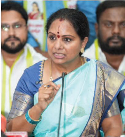
అధ్యక్షురాలు కవిత మిగతా 3లో..

హైదరాబాద్, ఏప్రిల్ 22: ఆర్టీసీ కార్మికుల సమస్యలను వెంటనే పరిష్కరించాలని జాగ్రత్తి అధ్యక్షురాలు కవిత మిగతా 3లో..