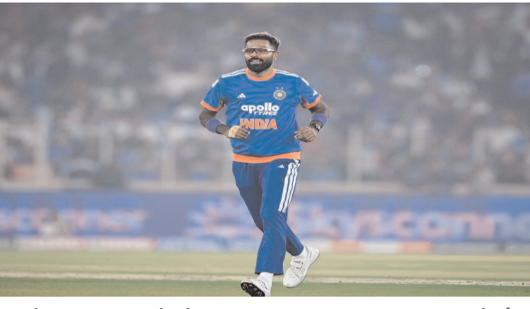
అర్ధరేలో ముందుకు ప్రమాణ్ చేసుకోవడం వల్ల జట్టు నష్టపోయిందని విమర్శించారు. అలాగే జన్లీవ్ బుర్రుతో మొదటి ఓవర్ వేయించడంపేర.. ఫామ్ లో లేని దీపక్ చాహార్ కు బంతుని ఇవ్వడం వంటి వ్యూహాత్మక లోపాలు ముంబై ఓటమికి కారణమయ్యాయని ఆయన విశ్లేషించారు.

బలగం టీవీ, న్యూఢిల్లీ ఐపీఎల్ 2026 సీజన్లో భాగంగా ముంబై ఇండియన్స్ జట్టు వరుస పరాజయాలతో సతమతంపడుతోంది. ఇప్పటివరకు ఆడిన 5 మ్యాచ్ లో కేవలం ఒకే ఒక్క విజయాన్ని నమోదు చేసిన ముంబై ఇండియన్స్.. పాయింట్ల పట్టికలో అట్టడుగు నుంచి రెంజ్ స్థానంలో ఉంది. గురువారం పంజాబ్ కింగ్స్ జట్టుతో జరిగిన మ్యాచ్ లో కూడా ఘోరంగా ఓడిపోవడంతో కెప్టెన్ హార్లీక్ పాండ్లూపై విమర్శలు వెల్లువెత్తుతున్నాయి. కేవలం మార్చి 29న కోల్కతా నైట్ రైడర్స్ జట్టుపై మాత్రమే ముంబై ఇండియన్స్ విజయం సాధించింది. ముంబై ఇండియన్స్ వైఫల్యాలపై మాజీ క్రెడెన్స్ మనోజ్ తివారీ ఘాటుగా స్పందించారు. హార్లీక్ పాండ్లూ కెప్టెన్స్ ఆశించిన స్టాయిల్ లేదని.. జట్టును ముందుండి నడిపించడంలో హార్లీక్ విఫలమవుతున్నాడని విమర్శించారు. రోహిత్ శర్మ సారథ్యంలో ముంబై జట్టు 2013 నుంచి 2023 మధ్య 5 క్రోఫీలను గెలుచుకుంది గుర్తు చేసిన మనోజ్ తివారీ.. రోహిత్ ను కెప్టెన్ గా ఉంచిన తొలిసారిగా హార్లీక్ పాండ్లూపై పట్టణం వేసినట్లు ఆయన ఆరోపణలు చేశారు. హార్లీక్ తనంతట తానుగా కెప్టెన్ గా బాధ్యతలను తీసుకోవడం అని ఆరోపణలు చేశారు. హార్లీక్ పాండ్లూపై 'అని మనోజ్ తివారీ సూచించారు. గత రెండేళ్లూ ముంబైకి క్రోఫీ రాలేదని.. ప్రస్తుత పరిస్థితులు చూస్తుంటే ఈ ఏడాది కూడా అదే పునరావృతమయ్యేలా ఉందని ఆయన ఆరోపణలు చేశారు. జట్టులో ఐకమత్యం లేమిందినందు, కెప్టెన్ నిర్ణయాలు సరిగ్గా లేవని ఆయన కంటపట్టలు కొట్టారు. పంజాబ్ కింగ్స్ తో జరిగిన మ్యాచ్ లో హార్లీక్ తీసుకున్న నిర్ణయాలను మనోజ్ తివారీ తప్పుబట్టారు. విద్యుంసకర బ్యాటర్ షెనాన్ రూపొందించిన కాదని, హార్లీక్ తనను తాను బ్యాటింగ్