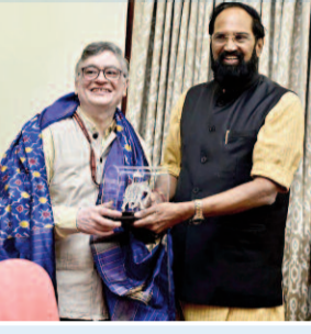
సీఎం రేవంత్ రెడ్డితో కలిసి మేడిగడ్డ మిగతా 3లో..