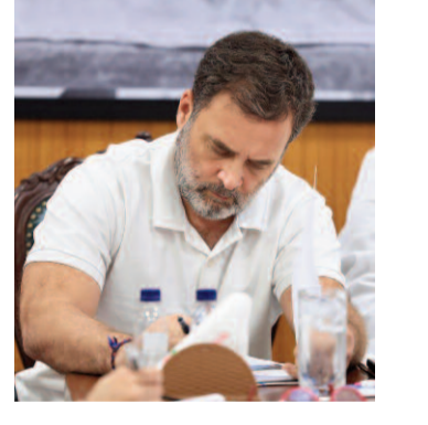
స్వయంగా నిర్వహించాలని లేదంటే.. ఒక కేంద్ర దర్యాప్తు

● బ్రిటన్ పౌరసత్వం కలిగి ఉన్నట్లు ఆరోపణలు ● విచారణకు ఆదేశించిన అలహాబాద్ హైకోర్టు న్యూఢిల్లీ, ఏప్రిల్ 17 : ద్వంద్వ పౌరసత్వం ఆరోపణలకు సంబంధించి లోక్ సభలో ప్రతిపక్ష నేత రాహుల్ గాంధీపై కేసు నమోదు చేయాలని అలహాబాద్ హైకోర్టు ఆదేశాలు జారీ చేసింది. దీనిపై విచారణ జరపాలని అక్కడి లభనపూ డెంచ్ ఉత్తర్వు లిచ్చింది. ఈ కేసు దర్యాప్తును ఉత్తర్ ప్రదేశ్ ప్రభుత్వమే