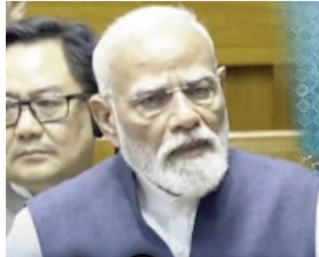
ప్రాంతాల చట్ట సవరణ బిల్లుపై లోక్ సభలో చర్య సందర్భంగా రాహుల్ ఈ వ్యాఖ్యలు చేశారు. మహిళా బిల్లు మునుగులో దేశ మిగతా 3లో..

● 2023లోనే ఆమోదించిన బిల్లును అమలు చేయండి ● లేదా కొత్తగా మహిళా బిల్లును తీసుకుని రండి ● బీసీ, దళితులు, మైనార్టీలు, మహిళల పట్ల క్రూర చర్య ● చర్యలో మోడీ ఓ మెజిషియన్ అంటూ రా హుల్ తీవ్రంగా విమర్శలు ● రాహుల్ తీరుపై మండిపడ్డ స్పీకర్ బర్లా.. కేంద్రమంత్రులు న్యూఢిల్లీ, ఏప్రిల్ 16 : ఇప్పటికే 2023లోనే మహిళా రిజర్వేషన్ బిల్లు ఆమోదం పొందిందని, దానినే అమలు చేయాలని ప్రతిపక్ష నేత రాహుల్ గాంధీ అన్నారు. ప్రస్తుతం ప్రతిపాదించిన బిల్లు మహిళల సాధికారత కోసం పెట్టింది కాదని విమర్శించారు. ఈ బిల్లు మునుగులో దేశ రాజకీయ చిత్రపటాన్ని మార్చే ప్రయత్నం జరుగుతోందని ఆరోపించారు. అంతగా కావాలంటే పాత మహిళా రిజర్వేషన్ బిల్లును రద్దు చేసి.. ఇప్పుడు కొత్తగా మళ్లీ తీసుకురావాలని కేంద్రానికి నూచించారు. లోక్ సభలో 131వ రాజ్యాంగ సవరణ, డీఐఎమ్ షన్, కేంద్రపాలిత