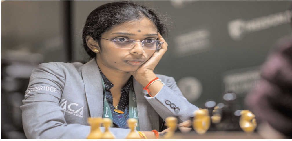
ప్రపంచ ఛాంపియన్ షిప్ కు లర్నెట్