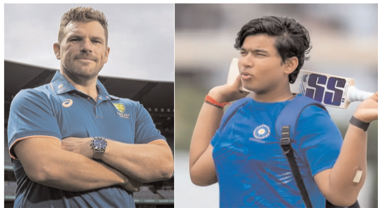
వినిపిస్తోంది. ఒకవేళ ఐర్లాండ్ సిరీస్లో అవకాశం రాకపోయినా, జింబావ్వే పర్యటన లేదా ఆసియా క్రీడల ద్వారా అతడిని అంతర్జాతీయ క్రీకెట్లోకి తీసుకురావాలని టీసీసీయే మోపిస్తోంది.