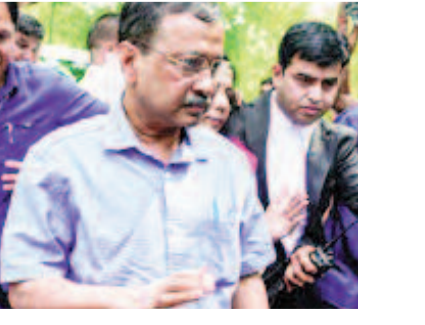
ఆరోపణలు చేశారు. ఎన్ఫోర్స్ మెంట్ డైరెక్టరీలో, సెంట్రల్ బ్యూరో ఆఫ్ ఇన్వెస్టిగేషన్ వంటి దర్యాప్తు సంస్థలు మొదట సాక్షులను ఆరోపణలు చేసి.. ఆ తర్వాత ఇతరులను ఇరికించేలా వారి నుండి బలవంతంగా వాంగ్మూలాలు తీసుకుంటున్నారని మిగతా 3లో..