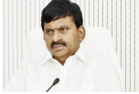
ముఖ్యమంత్రి రేవంత్ రెడ్డి గారి నాయకత్వంలో పునర్నిర్మిస్తున్న భూ పరిపాలనను రాష్ట్ర రెవెన్యూ, హౌసింగ్, సమాచార శాఖ మంత్రి పాంగులేటి శ్రీనివాసరెడ్డి తెలిపారు. భూహక్కుల పరిరక్షణ, పారదర్శకత, అవినీతి రహిత సేవలు సామాన్యుడికి సులభంగా అందేలా గత ఏడాది రాష్ట్ర ప్రభుత్వం తీసుకొచ్చిన మిగతా 3లో..

హైదరాబాద్, ఏప్రిల్ 13 : అనాటి బీఆర్ఎస్ ప్రభుత్వంలో కుప్పకూలిన రెవెన్యూ వ్యవస్థను గౌరవ