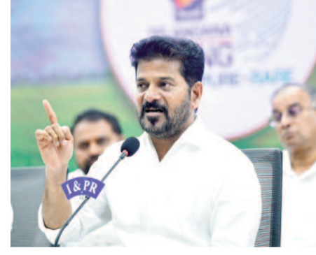
చారు. సోమవారం సాయంత్రం సచివాలయంలో ఆయన మత్రులు, ఎంపిలు, ఇతర నాయకులతో కలసి మీడియా సమావేశంలో మాట్లాడారు. మహిళా రిజర్వేషన్ల విషయంలో కాంగ్రెస్ పార్టీకి వ్యతిరేకంగా దుష్ప్రచారం జరుగుతోందని రేవంత్ రెడ్డి ఘోషించారు. మహిళలకు ఓటాహక్కు, రాజకీయ రిజర్వేషన్లు కల్పించడంలో కాంగ్రెస్ పార్టీ కీలక పాత్ర పోషించిందని ఆయన గుర్తు చేశారు. కాంగ్రెస్ హయాంలోనే మహిళల ముఖ్యమైన మిగతా 3లో..

హైదరాబాద్, ఏప్రిల్ 13: మహిళా రిజర్వేషన్లు, పునర్విభజనను కలవడంతో రాజకీయ కుట్ర ఉందని సిఎం రేవంత్ రెడ్డి ఆరోపించారు. 2026 జనాభా లెక్కల ప్రకారం మహిళా రిజర్వేషన్ల బిల్లు తీసుకువస్తే కాంగ్రెస్ పార్టీ సంపూర్ణ మద్దతు ఇవ్వడంతో పాటు కట్టుబడి ఉంటామని ప్రకటించిన విషయాన్ని గుర్తు చేశారు. మహిళా రాజకీయ సాధికారతకు కాంగ్రెస్ మొదటి నుంచి కట్టుబడి ఉంది.. నియోజకవర్గాల పునర్విభజనను ప్రధాని మోడీ రాజకీయ పావుగా ప్రమాదకరంగా వాడుకుంటున్నారని ఆరోపించారు. డీలిమిటేషన్, మహిళా రిజర్వేషన్ల అంశాలపై తెలంగాణ ముఖ్యమంత్రి రేవంత్ రెడ్డి కీలక వ్యాఖ్యలు చేశారు. మహిళా రిజర్వేషన్ బిల్లు ఆమోదం కోసమే పార్లమెంట్ ప్రత్యేక సమావేశాలు నిర్వహిస్తున్నారని ఆయన ఘోషించారు. డీలిమిటేషన్ అనేది రాజకీయ పార్టీలకో, ప్రభుత్వానికో సంబంధించిన అంశం కాదని స్పష్టం చేసిన సిఎం రేవంత్, దీనిని మహిళా రిజర్వేషన్లతో కలిపి చూపించడం సరైనది కాదన్నారు. అయితే కేంద్ర ప్రభుత్వం ఈ రెండు అంశాలను కలిపి వ్యూహాత్మకంగా ముందుకు సాగుతోందని విమర్శించారు.