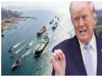
జలసంధిని దిగ్బంధిస్తామని అమెరికా సెంట్రల్ కమాండ్ ఇప్పటికే ప్రకటించిన సంగతి తెలిసిందే. దీంతో పాటు ఇరాన్ పై మిగతా 3లో..

వాషింగ్టన్, ఏప్రిల్ 13 : అమెరికా-ఇరాన్ మధ్య శాంతి చర్చలు విఫలమవడంతో పశ్చిమాసియా మళ్ళీ నిప్పురుగిస్తున్నట్లు తెలుస్తోంది. ఏ క్షణాన ఏం జరుగుతుంది అర్థం కాని పరిస్థితి నెలకొంది. మరోవైపు, ఇరాన్ పై మళ్ళీ దాడులు ప్రారంభించేందుకు అమెరికా, ఇజ్రాయిల్ సిద్ధమవుతున్నట్లు వార్తలు రావడం ఆందోళన కలిగిస్తోంది. హర్యాజ్