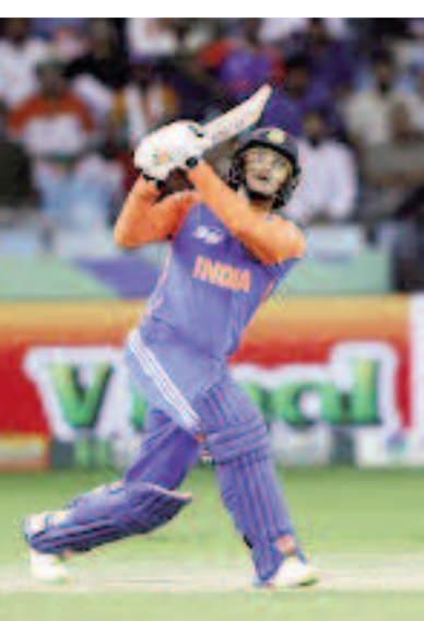
అధిపత్యం చెలాయిస్తుండగా.. భారత స్టార్ ఆల్ రౌండర్ హరికేట్ పాండ్య రెండో స్థానాన్ని నిలబెట్టుకున్నాడు. న్యూజిలాండ్ తో సిరీస్లో విశేషంగా రాణించిన దక్షిణాఫ్రికా బౌలర్లు గెరాల్డ్ కోయెట్, ఒట్నీల్ బార్దమాన్ లాంటి అద్భుత ఆటగాళ్లు బొలింగ్ ర్యాంకింగ్స్లో భారీగా ఎగతాళారు. రాసున్న ఇంగ్లండ్ సిరీస్ కు ముందు టీమిండియా ఆటగాళ్లు మూడు విభాగాల్లోనూ సత్తా చాటుతుండటం భారత క్రికెట్ అభిమానుల్లో ఉత్సాహం నింపుతోంది.

ఇంగ్లండ్ వెటరన్ బ్యాటర్ జోన్ బట్లర్ ఒక స్థానం ఎగతాళి అనిమిషో ర్యాంకుకు చేరుకోగా, న్యూజిలాండ్ కు చెందిన టీమ్ సీఫర్డ్ ఒక స్థానం దిగజారి తొమ్మిదో ర్యాంకుతో సరిపెట్టుకున్నాడు. ఇటీవలే న్యూజిలాండ్ తో జరిగిన టీ20 సిరీస్లో అద్భుతంగా రాణించి ‘ఫ్లేయర్ ఆఫ్ ది సిరీస్’ అవార్డు దక్కించుకున్న దక్షిణాఫ్రికా ఆటగాడు కోసర్ ఎస్టరహజెన్ తన ర్యాంకును అమాంతం మెరుగుపరుచుకున్నాడు. గతంలో టాప్ 100 వెలువల ఉన్న అతను ఏకంగా 39వ స్థానానికి దూసుకురావడం క్రికెట్ చరిత్రలో చర్చనీయాంశంగా మారింది. అదే సిరీస్లో మెరుగైన ప్రదర్శన కనబరిచిన కిషన్ ఆటగాడు టీమ్ రాబిన్సన్ 32వ స్థానానికి చేరుకున్నాడు. బొలింగ్ విభాగం విషయానికి వస్తే ఆఫ్ఝనిస్థాన్ స్టార్ స్పిన్నర్ రషీద్ ఖాన్ అగ్రస్థానాన్ని పదిలం చేసుకున్నాడు. భారత అగ్రశ్రేణి స్పిన్నర్ వరుణ్ చక్రవర్తి రెండో స్థానంలో నిలవగా, స్టార్ పేసర్ జస్ప్రీత్ బుద్రా ఐదో ర్యాంకులో కొనసాగుతున్నాడు. ఆల్ రౌండర్ జాబితాలో జింబావ్వే కెప్టెన్ సీకండర్ రజా అగ్రస్థానంలో