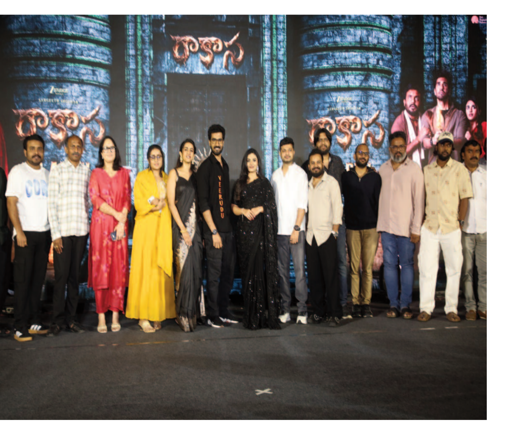
నిర్వాత కొడిదల సహారక

బాలీవుడ్ స్టార్ హీరో రణవీర్ కపూర్ ప్రధాన పాత్రలో ప్రముఖ దర్శకుడు నితీష్ తివారీ తెరకెక్కిస్తున్న ధారాత్మిక చిత్రం 'రామాయణ'. దాదాపు రూ.3000 కోట్ల బడ్జెట్ తో రాబోతున్న ఈ చిత్రం దీపావళి కానుకగా ప్రేక్షకుల ముందుకు రాబోతుం దగా.. తాజాగా ఈ సినిమా టీజర్ కు సెంట్రల్ బోర్డ్ ఆఫ్ ఫిల్మ్ సర్టిఫికేషన్ క్లియరెన్స్ ఇచ్చింది. ఈ చిత్రం నుంచి 'రామ' పేరుతో రాబోతున్న ఈ టీజర్ విడుదలకు ముందు సెన్సార్ బోర్డు నుంచి గ్రీన్ సిగ్నల్ రావడంతో ఏప్రిల్ 2న టీజర్ విడుదల చేయడానికి మార్గం సుగమమైంది. దీనితో పాటు ఈ టీజర్ నిడివికి సంబంధించిన వివరాలు కూడా వెల్లడయ్యాయి. ప్రస్తుతం అందుతున్న సమాచారం ప్రకారం, 'రామ' టీజర్ రన్ టైమ్ 2 నిమిషాల 38 సెకన్లుగా ఉంది. ఈ టీజర్ కు సెన్సార్ బోర్డు యూనివర్సల్ సీల్ డిగ్రీ ఇచ్చింది, దీంతో ఈ టీజర్ ను అన్ని వయసుల వారు ఢిల్లీలో విక్షించవచ్చు. ఇప్పటివరకు చిత్రబృందం కేవలం టైటిల్ వీడియోతో పాటు 3 నిమిషాల 3 సెకన్ల నిడివి గల 'రామాయణ: ది ఇంట్రడక్షన్' అనే క్లిప్ ను మాత్రమే పంచుకుంది. భారీ వీఎఫ్ఎక్స్ హంగులతో కూడిన ఆ వీడియోలో శ్రీరాముడిగా రణవీర్ కపూర్, రావణుడిగా కన్నడ స్టార్ యష్ లక్ష్మణుల సంబంధించిన ఫస్ట్ లుక్ ను చూపించారు. అయితే ఇప్పుడు రాబోతున్న టీజర్ ఎలా ఉందో బోతుందని అందరూ ఆసక్తికరంగా ఎదురుచూస్తున్నారు. ఇక ఈ దృశ్యకావ్యం 2026 నవంబర్ లో దీపావళి కానుకగా ప్రపంచవ్యాప్తంగా ఢిల్లీలో విడుదల కానుంది.