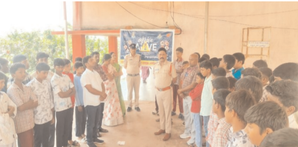
ప్రేరేపించాలని అన్నారు. ఈ అవగాహన కార్యక్రమం ద్వారా భవిష్యత్తులో రోడ్డు ప్రమాదాల సంఖ్యను గణనీయంగా తగ్గించగలమని అన్నారు.