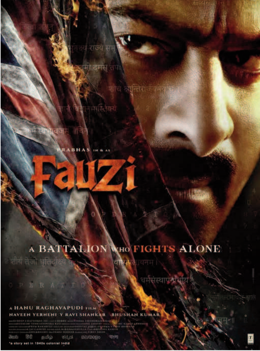
స్ట్రాయిల్ ఉన్న చాలా మంది స్టార్ హీరోలు ఒకేసారి ఒక్క ప్రాజెక్ట్ పైనే దృష్టి సారిస్తుంటే,

ప్రస్తుతం స్టార్ హీరోలు ఏడాదికి ఒక సినిమాని రిలీజ్ చేయడానికే భారీగా క్రమిస్తున్న సమయంలో, పాస్ ఇండియా స్టార్ ప్రభాస్ మాత్రం తన పని తీరుతో ఏకకాలంలో మూడు భారీ ప్రాజెక్టులను నిర్వహిస్తూ చిత్రపరిశ్రమలో చర్చనీయాంశంగా మారారు. ప్రస్తుతం ప్రభాస్ 'స్పిరిట్', 'ఫౌజీ', 'కల్కి 2' వంటి మూడు భారీ బ్లడ్ బేట్ చిత్రాల్లో నటిస్తున్నారు. ఈ మూడు సినిమాలు భిన్నమైన కథాంశాలు, వేర్వేరు పాత్రలతో తెరకెక్కుతున్నాయి. అలాంటి పరిస్థితుల్లో ఒకేసారి మూడు సినిమాలలో పాల్గొనడం పెద్ద సవాల్. రెండు మూడు నెలలుగా 'ఫౌజీ', 'స్పిరిట్' షూటింగ్ లో నిరంతరం పాల్గొంటున్న ప్రభాస్, ఇప్పుడు 'కల్కి 2' షూటింగ్ కు కూడా రెడీ అవుతున్నారు. ఇప్పటివరకు ఆయన లేకుండా తీసిన సన్నివేశాలను పూర్తి చేసిన దర్శకుడు నాగ్ అశ్విన్, ఇక నుంచి ప్రభాస్ తో కూడిన షూటింగ్ ను ప్రారంభించేందుకు సిద్ధమవుతున్నారు. మూడు సినిమాలు ఒకేసారి చేయడం వల్ల ప్రభాస్ షెడ్యూల్ మరింత బిజీగా మారనుంది. రాత్రింబవళ్లు షూటింగ్ లో గడపాల్ని వస్తోంది. ప్రతి సినిమాలో వేర్వేరు లుక్స్, బాడీ లాంగ్ వేజ్ అవసరం కావడంతో పాత్రల మధ్య తేడాను కచ్చితంగా చూపించాల్సిన బాధ్యత కూడా ఉంది. ప్రభాస్ పనితీరు ఆయన ప్రాఫెషనల్ కమిట్మెంట్ ను స్పష్టంగా చూపిస్తోంది. గతంలో కూడా 'సలార్', 'కల్కి 2898', 'అదిపురుష్' వంటి సినిమాలు ఒకేసారి బ్యాండ్ చేసిన అనుభవం ఆయనకు ఉంది. అయితే ఇప్పుడు పరిస్థితులు మరింత కఠినంగా ఉండటంతో ఆయనపై ఒత్తిడి కూడా పెరిగింది. ప్రస్తుతం పాస్ ఇండియా