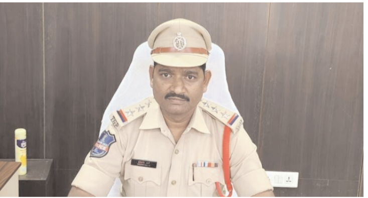
అయితే, భవిష్యత్తులో ఉద్యోగ మరియు ఉపాధి అవకాశాలపై ప్రభావం పడే అవకాశం ఉందని, పోలీస్ వెరిఫికేషన్ సమయంలో ఇబ్బందులు తలెత్తవచ్చని హెచ్చరించారు. అలాగే ట్రాఫిక్ మరియు రోడ్ భద్రత నియమ నిబంధనలను ఉల్లంఘించే వారిపై కఠిన చర్యలపై మనస్ఫూర్తిగా చర్యలు తీసుకుంటామని తెలిపారు.