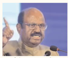
సీఎం ఆనంద్ బోస్

పశ్చిమ బెంగాల్ అసెంబ్లీ ఎన్నికలు సమీపిస్తున్న వేళ రాష్ట్ర రాజకీయాల్లో కీలక పరిణామం చోటుచేసుకుంది. రాష్ట్ర గవర్నర్ సీఎం ఆనంద్ బోస్ తన పదవీకి రాజీనామా చేసినట్లు లోకసభలో వర్గాలు వెల్లడించాయి. అయితే ఆయన రాజీనామాకు గల స్పష్టమైన కారణాలు ఇప్పటివరకు వెల్లడికాలేదు. ఈ పరిణామంపై పశ్చిమ బెంగాల్ ముఖ్యమంత్రి మమతా బెనర్జీ స్పందిస్తూ ఆశ్చర్యం వ్యక్తం చేశారు. గవర్నర్ రాజీనామా విషయం తెలిసి తాను షాకయ్యానని ఆమె తెలిపారు. "గవర్నర్ రాజీనామాకు గల అసలు కారణం నాకు కూడా తెలియదు. ప్రస్తుత పరిస్థితులను చూస్తుంటే ఏదైనా రాజకీయ ఒత్తిడి ఉండొచ్చని అనిపిస్తోంది. త్వరలో జరగనున్న అసెంబ్లీ ఎన్నికల నేపథ్యంలో కేంద్రం నుంచి ఆయనపై ఒత్తిడి ఉండి ఉండొచ్చు" అని మమతా వ్యాఖ్యానించారు.