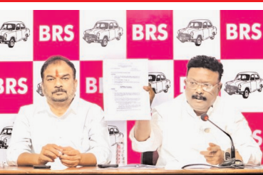
బలగం టీవీ, హైదరాబాద్