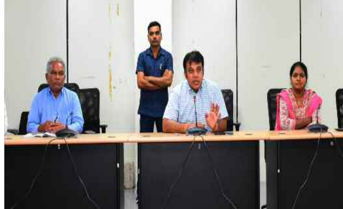
అనుమానితులనుండి రక్ష సమానాలు సేకరించి పరిశుభ్ర నిమిత్తం పంపించాలని అన్నారు. జిల్లాలో ఉన్న ప్రతి ప్రాథమిక ఆరోగ్య కేంద్రం వద్ద దెంగూ రాబిడ్ టెస్ట్ లు అవసరమైన మందులు అందుబాటులో ఉంచుకోవాలని అన్నారు. ప్రతి మంగళవారం మరియు శుక్రవారం డ్రై డే కార్యక్రమం కింద నిల్వ ఉన్న నీరు తొలగించాలని, ఇంటిలో నీరు