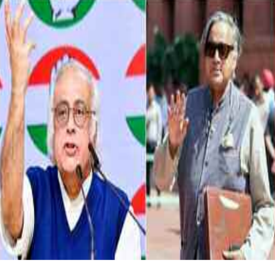
ఆయన్ని ఎంపిక చేసినందుకూ ఎక్స్ ప్రెస్ రాసుకొచ్చారు. ప్రస్తుతం ఈ టీవీల్ వైరల్ అవుతోంది.

న్యూఢిల్లీ, మే 17: పాకిస్తాన్ ఉగ్ర కుట్రలను ప్రపంచదేశాలకు వివరించడం కోసం ఏడు అఖిలపక్ష బృందాలను కేంద్రం ఏర్పాటు చేసిన విషయం తెలిసిందే. ఆ ప్రతినిధుల బృందాలకు రాష్ట్రం వహించే ఏడుగురు వివిధ రాజకీయ పార్టీల ఎంపీల పేర్లను శనివారం ప్రకటించింది. వీరిలో కాంగ్రెస్ నుంచి సీనియర్ నాయకుడు శశిధర్మూర్తి ఉన్నారు. కేంద్ర మంత్రి కిరణ్ రిజ్జా కోరిక మేరకు ఆయన పార్టీలు తమ నేతల పేర్లను ప్రభుత్వానికి పంపారు. అయితే, కాంగ్రెస్ పంపిన లిస్ట్లో శశిధర్మూర్తి పేరు లేకపోయినా అనూహ్యంగా ఆయనను కేంద్ర ప్రభుత్వం ఎంపిక చేసింది. ఈ విషయాన్ని కాంగ్రెస్ నేత జైరామ్ రమేష్ ఎక్స్ వేదికగా తెలిపారు. కిరణ్ రిజ్జా (మే 16) షార్లమెంటరీ వ్యవహారాల శాఖ మంత్రి నిర్మల రిజ్జా.. కాంగ్రెస్ అభ్యర్థుడు మల్లికార్జున్ ఖర్గే, లోక్ సభలో ప్రధాన ప్రతిపక్ష నేత రాహుల్ గాంధీ మాట్లాడినట్లు చెప్పారు. పాక్ ఉగ్రవాదంపై భారత్ వెళ్లింది ప్రపంచదేశాలకు వివరించేందుకు విదేశాలకు పంపే ప్రతినిధుల బృందాలకు నలుగురు ఎంపీల పేర్లను ప్రతిపాదించాలని కోరినట్లు చెప్పారు. ఆయన విజ్ఞప్తి మేరకు నిన్న మధ్యాహ్నం కాంగ్రెస్ పార్టీ ఆనంద్ శర్మ, గౌరవ్ గోగోయ్, డాక్టర్ సయ్యద్ సనీర్ హుస్సేన్, రాజ్ లాల్ పేర్లను పంపినట్లు చెప్పారు. కాంగ్రెస్ పంపిన ప్రతిపాదనలో ధర్మూర్తి పేరు లేదని వెల్లడించారు. అయితే, కేంద్రం అనూహ్యంగా