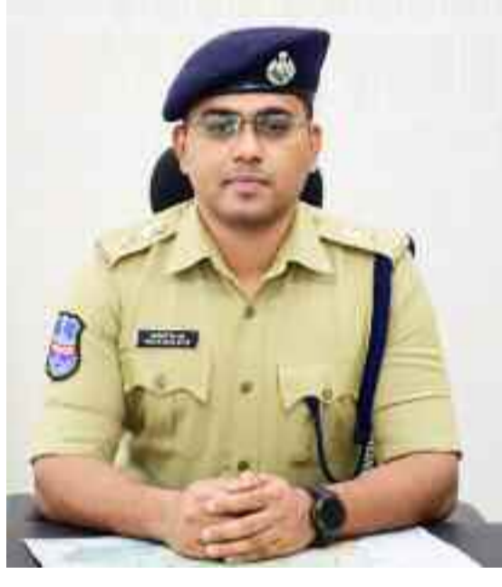
నడివేారిపైన కఠినంగా వ్యవహరించడమే కాకుండా వారికి నిరంతరం కొన్నింటిని ఇవ్వడం, సూచనలు చేయడం అంతే కాక పాఠశాలలకు, కళాశాలలకు వెళ్లి విద్యార్థులతో మమేకమై పాఠించాల్సిన నియమాలు వివరించడం వంటి కార్యక్రమాలు చేపట్టడం జరుగుతుందన్నారు అన్నారు.

బలగం డివి, రాజన్న సిరిసిల్ల: మద్యం సేవించి వాహనం నడిపే ప్రమాదాలకు కారణం అయితే అడ్డీ వారిపై కేసులు నమోదు చేయడం జరుగుతుందని జిల్లాలో ప్రతి పోలీస్ స్టేషన్ పరిధిలో ప్రతిరోజూ డ్రంక్ అండ్ డ్రైవ్ టెస్టులు, వాహన తనిఖీలు నిర్వహించడం జరుగుతుందని ఎస్సీ మహాషి బి.గితే శనివారం ఒక ప్రకటనలో తెలిపారు. ఈ సందర్భంగా ఎస్సీ మహాషి బి.గితే మాట్లాడుతూ తరచు డ్రంక్ అండ్ డ్రైవ్ చేస్తూ పట్టుబడిన వ్యక్తుల యొక్క డ్రైవింగ్ లైసెన్స్ తీసుకొని ఆ యొక్క లైసెన్స్ రద్దుకు సంబంధిత రవాణా శాఖ అధికారులకు సిఫారసు చేయడం జరుగుతుందన్నారు. రోడ్డు ప్రమాదాల నివారణ లక్ష్యంగా ప్రమాం తప్పకుండా డ్రంక్ అండ్ డ్రైవ్ పరిశీలన నిర్వహించడంతో పాటు, ట్రాఫిక్ నిబంధనలు, రోడ్డు అవగాహన కార్యక్రమాలు నిర్వహిస్తున్నామని తెలిపారు. అలాగే మైసర్లు వాహనాలు నడుపుతూ పట్టుబడితే వారి తల్లదండ్రులకు బాధ్యత వహించాలని హెచ్చరించారు. తాగి వాహనాలు నడపవద్దని, పట్టుబడిన వారిని వారి కుటుంబ సభ్యుల సమక్షంలో కొన్నింటిని నిర్వహిస్తూ కోర్టులో హాజరు చేయడం జరుగుతుందని, మద్యం సేవించి మొదటిసారి పట్టుబడిన రెండవసారి పట్టుబడిన వారు సేవించిన మద్యం మోతాదులను బట్టి తప్ప నిసరిగా శిక్షలు విధించబడతాయని అన్నారు. ట్రాఫిక్ నియంత్రణపై, మద్యం తాగివాహనాలు