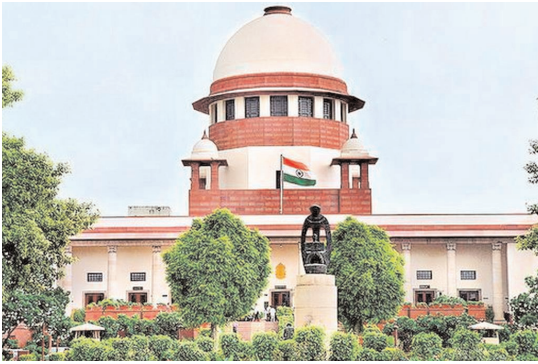
బలగం టీవీ, హైదరాబాద్ బ్యూరో