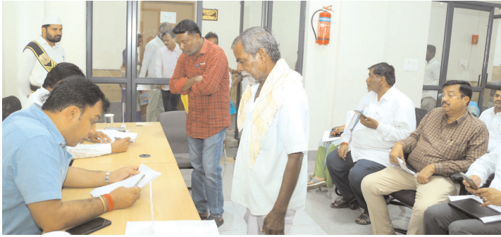
బలగం టీవీ , రాజన్న సిరిసిల్ల