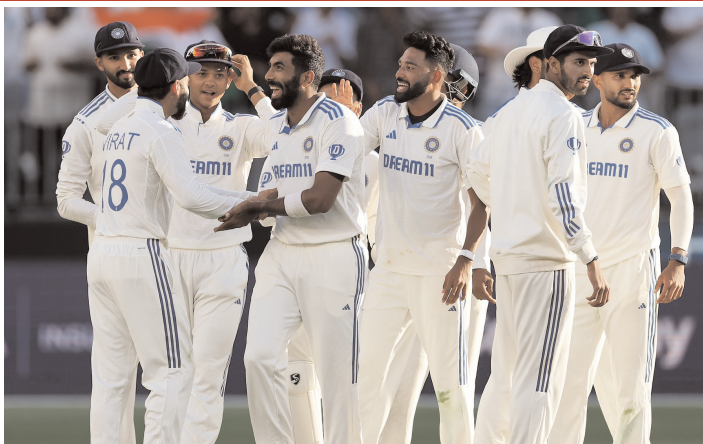
బలగం టీవీ, పెర్ట్

బోర్డర్ గవాస్కర్ ట్రోఫీలో భాగంగా భారత్, ఆస్ట్రేలియా జట్ల మధ్య జరుగుతున్న ఐదు మ్యాచ్ల టెస్టు సిరీస్లో భారత్ శుభారంభం చేసింది. పెర్ట్ వేదికగా జరిగిన తొలి టెస్టులో భారత జట్టు ఘన విజయం సాధించింది. 295 పరుగుల తేడాతో రికార్డు విజయాన్ని నమోదు చేసింది. ఈ గెలుపుతో ఐదు మ్యాచ్లలో సిరీస్లో 1-0 అధిక్యంలోకి దూసుకెళ్లింది. 534 పరుగుల క్షీణమైన లక్ష్యంతో బ్యాటింగ్ కు దిగిన ఆస్ట్రేలియా 238 పరుగులకు కుప్పకూలింది. మ్యాచ్లో 8 వికెట్లు తీసి టీమిండియా విజయంలో కీలక పాత్ర పోషించిన కెప్టెన్ జస్ బ్రూమ్ బుర్రూకు ఫైయర్ ఆఫ్ ది మ్యాచ్ అవార్డు లభించింది.