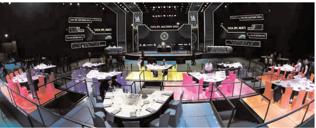
బలగం టీవీ, దుబాయ్