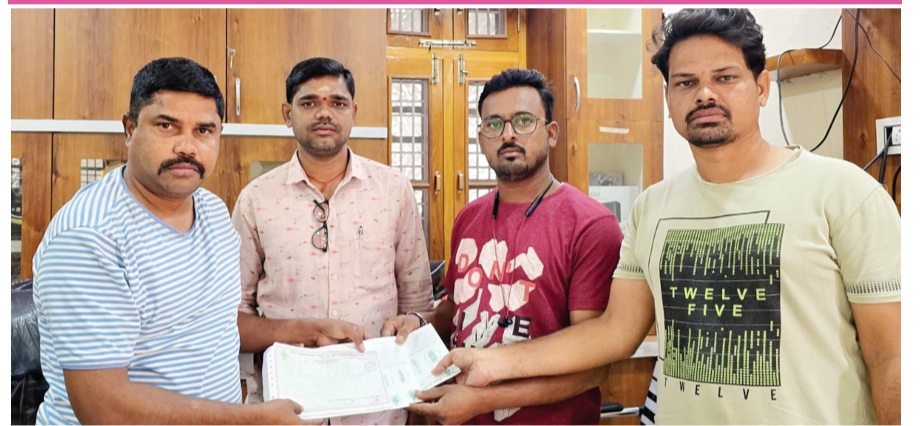
బలగం టీవీ, సిరిసిల్ల