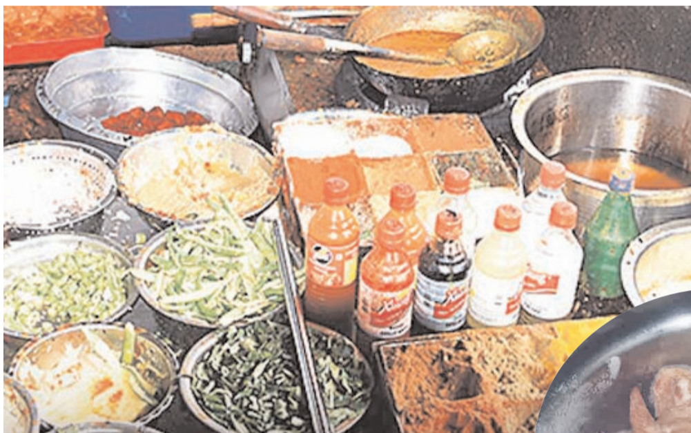
బలగం టీవీ, హైదరాబాద్

కట్రి ఆహారంతో హైదరాబాద్ బిర్యానీ బ్రాండ్ డెబ్బతింది. నగరంలో హెబాటల్స్ కనీస నాణ్యత ప్రమాణాలు పాటించబడటం సర్వేలో వెల్లడైంది. నేషనల్ క్రెమ్ రికార్డ్స్ బ్యూరో తాజాగా చేసిన సర్వే సంచలనం రేపింది. దేశంలోని 19 ప్రధాన నగరాల్లో నిర్వహించిన ఈ సర్వే ప్రకారం, హైదరాబాద్ ఘడ్ క్యాటిగోరిలో చివరి స్థానానికి వదిలిపోయింది. నగరంలోని 62 శాతం హెబాటల్స్ గడుపు