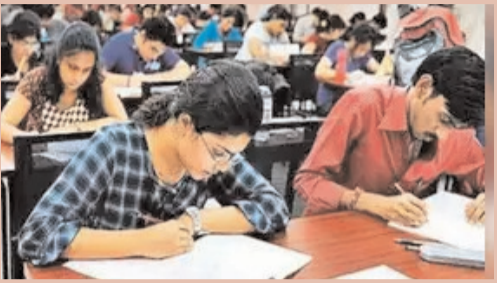
వివరాలు 3వ పేజీలో