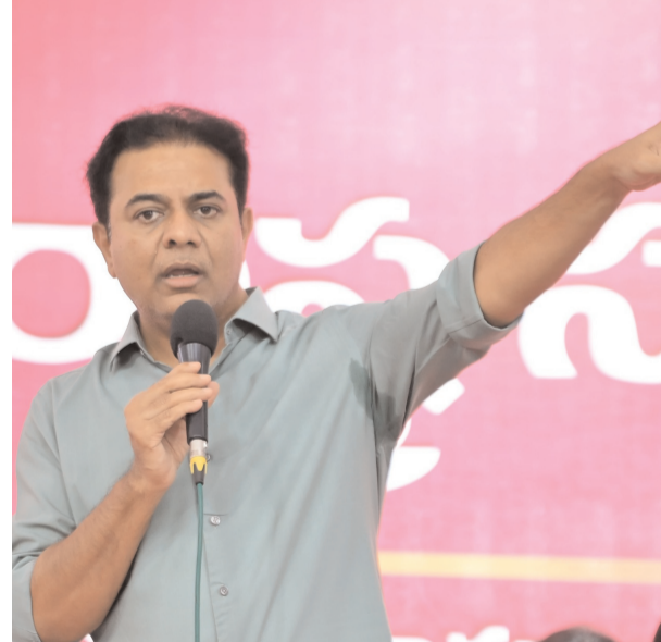
• మాజీ మంత్రి, ఎమ్మెల్యే కేటీఆర్