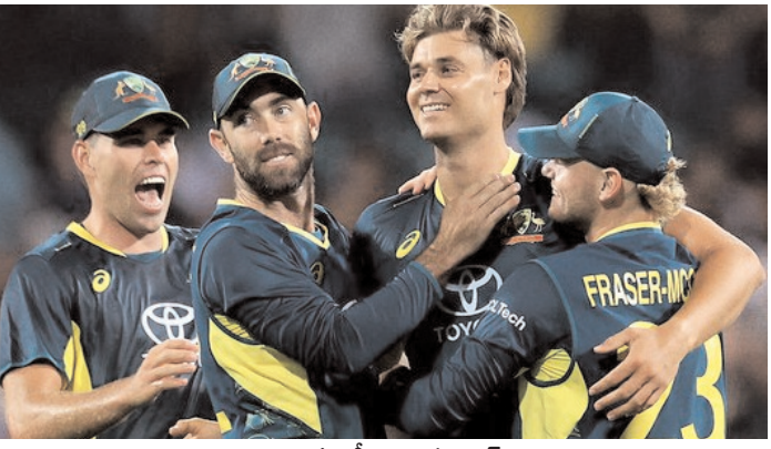
బలగం టీవీ, హైదరాబాద్

పాకిస్తాన్ తో వన్డే సిరీస్ కోల్పోయిన ఆస్ట్రేలియా టీ20 సిరీస్ కైవసం చేసుకుంది. గబ్బా మైదానంలో గ్లెన్ మ్యాక్స్ వెల్ మెరుపులతో జయకేతనం ఎగురువేసిన ఆసీస్ రెండో టీ20లోనూ ఆదే జోరు చూపింది. ప్రత్యర్థిపై 13 పరుగుల విజయంతో సిరీస్ లో రెండడుగులు ముందుకేసింది. మొదట ఓ పెనర్ల మాథ్యూ వార్నర్ (32), జేక్ ఫ్రెజర్ మెక్ గుర్నీ (20) లు పాక్ పేసర్లకు దడ పుట్టిస్తూ 3.4 ఓవర్లనే 54 పరుగులు జోడించారు. ఈ జంటను విడదీసిన హ్యారీస్ రవఫ్ (4/22) పాక్ కు బ్రేకిచ్చాడు. ఆ తర్వాత సుఫీయన్, అబ్బాస్ అఫ్రిదిలు కూడా చెలరేగగా ఆసీస్ కష్టాల్లో పడింది. గత మ్యాచ్ హీరో గ్లెన్ మ్యాక్స్ వెల్ (21) ధనాధన్ అడలేకపోయాడు. ఆఖర్లో అరోన్ హార్టీ (28), టీమ్ డేవిడ్ (18)లు బ్యాట్ రుసులిపించగా ఆసీస్ నిర్ణీత ఓవర్లలో 9 వికెట్లు కోల్పోయి 147 పరుగులు చేసింది. స్వల్ప ఛేదనలో జాన్సన్ పాక్ నడ్డివిరిచాడు. యువపేసర్ స్పెన్సర్ జాన్సన్ (5/26) నిప్పులు చెరిగాడు. పాక్ బ్యాటర్లలో ఓవైపు అందరూ దగ్గోట్ కుక్క కడుతున్నా ఉన్నా ఖాన్ (52) ఒక్కడే అర్ధ శతకంతో ఒంటరి పోరాటం చేశాడు. అతడిని కూడా పెవిలియన్ పంపిన జాన్సన్ ఆస్ట్రేలియా సిరీస్ విజయంలో ముఖ్య భూమిక పోషించాడు. ఆసీస్ 13 పరుగుల తేడాతో విజయం సాధించింది.