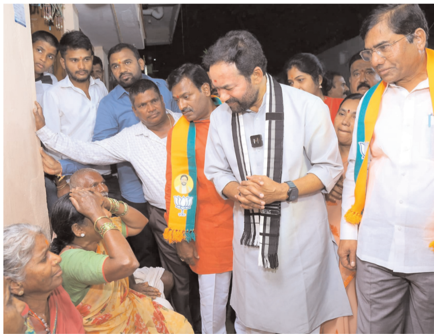
బలగం టీవీ, హైదరాబాద్

మూసీ పరివాహక ప్రాంతాల్లో 'బీజేపీ మూసీ నిద్ర' కార్యక్రమం శనివారం రాత్రి ప్రారంభమైంది. మూసీ సుందరీకరణ పేరుతో మూసీ వాసుల ఇళ్లను కూర్చారు. అక్కడి ప్రజలను మరోచోటుకు తరలించడం పట్ల బీఆర్ఎస్ తో పాటు బీజేపీ వ్యతిరేకిస్తున్న సంగతి తెలిసింది. ఎన్నో ఏళ్లుగా ఇక్కడ నివాసం ఉంటున్న వారిని ఇక్కడి నుండి వేరే చోటికి వెళ్లమని చెప్పడం.. ఇబ్బందికూర్చే అంబేద్కర్ అని వారంతా ప్రశ్నించారు. అయితే సిఎంఎల్ తరహాలో హైదరాబాద్లో మూసీని పునరుద్ధింపజేస్తామంటూ తెలంగాణ లోని రేవంత్ సర్కార్ చెబుతోంది. మూసీ పునరుద్ధింపానికి అడ్డుపడితే బుల్డోజర్లతో తోక్కిస్తామని రేవంత్ రెడ్డి హెచ్చరించారు. రేవంత్ కామెంట్లకు బీజేపీ నేత, కేంద్రమంత్రి కిషన్ రెడ్డి కొండర్ ఇచ్చారు. మూసీ ప్రాంతం పేదలకు మనోధైర్యం కల్పించేందుకు, వారికి అండగా ఉంటామని కిషన్ రెడ్డి పట్టుబాటుగా స్పందించారు. సీఎం వ్యాఖ్యలను తప్పుబట్టిన కిషన్ రెడ్డి.. బుల్డోజర్ల వస్తే చాపడానికైనా సిద్ధమేనని చెప్పారు. ఈ క్రమంలోనే మొన్న మూసీ వద్దా నిద్రపోగలరా అంటూ సీఎం రేవంత్ రెడ్డి చేసిన సవాల్ ను స్వీకరించిన కేంద్ర మంత్రి కిషన్ రెడ్డి దానికి తగినట్లుగా మూసీ పరివాహక ప్రాంతాల్లో బీజేపీ నిద్ర