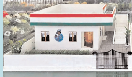
వివరాలు 3వ పేజీలో