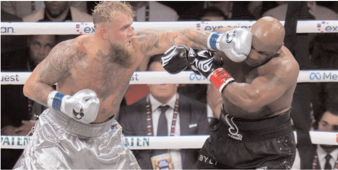
బలగం టీవీ, హైదరాబాద్

ప్రపంచ గొప్ప బాక్సర్లలో ఒకరైన 58 ఏండ్ల మైక్ ట్రైసన్ ఓ 27 ఏండ్ల బాక్సర్ జేక్ పాల్ చేతిలో ఓడిపోయాడు. మ్యూచ్ మొత్తంలో ట్రైసన్ పై జేక్ పాల్ ఆధిపత్యం చెలాయించాడు. ఆ క్రమంలో ట్రైసన్ శరీరం, ముఖంపై బలమైన పంచలను కొట్టాడు. దీంతో మ్యూచ్ ను పాల్ 78-74 తేడాతో గెలుచుకున్నాడు. టెక్సాస్ లో జరిగిన బిగ్ బోట్ లో.. 58 ఏళ్ల ట్రైసన్ తన కన్నా 37 ఏళ్ల చిన్నదైన జేక్ చేతిలో పరాజయాన్ని చవిచూశాడు. ఓ దశలో బాక్సింగ్ ప్రపంచాన్ని తన వైపు తిప్పుకున్న ట్రైసన్.. ఈ