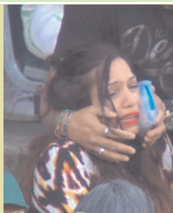
బలగం టీవీ, హైదరాబాద్

దక్షిణాఫ్రికాతో జరిగిన 4వ టీ20లో సంజూ శాంసన్ కొట్టిన ఓ భారీ సిక్సర్ తో గ్యాలరీలో ఉన్న ఓ మహిళా అభిమానికీ గాయమైంది. శాంసన్ సిక్సర్ ధాటికి ఓ లేడీ ఫ్యాన్ దవడ పగిలింది. ఆమెకు నొప్పితో విలవిలలాడింది. ఐస్ ప్యాక్ పెట్టుకుని కన్నీటి పర్యంతమైంది. ఈ దృశ్యాలు సోషల్ మీడియాలో చక్కర్లు కొడుతున్నాయి. దీనికి సంబంధించిన వీడియో నెట్టింట్ వైరల్ గా మారింది. సదరు మహిళా అభిమానికీ దెబ్బ తగిలిన విషయాన్ని గుర్తించిన సంజూ శాంసన్ ఆమెకు సైగలతో క్షమాపణలు కూడా చెప్పాడు. ట్రీప్స్ స్టబ్బ్ వేసిన 10వ ఓవర్లో ఈ సంఘటన చోటు చేసుకుంది.