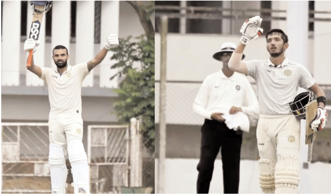
బలగం టీవి, హైదరాబాద్