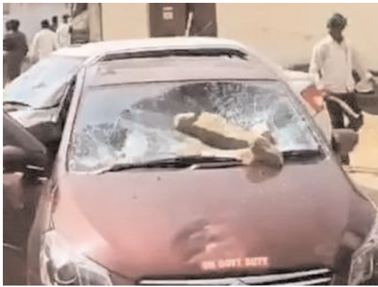
బలగం టీవీ, హైదరాబాద్

వికారాబాద్ జిల్లా దుద్యాల మండలం లగచర్లలో అధికారులపై దాడి, అనంతరం జరిగిన పరిణామాలపై మల్టీజోన్-2 ఐజీ సత్యనారాయణ గురువారం విచారణ చేపట్టారు. పరిగి పోలీస్ స్టేషన్లో అదనపు డీజీ మహేశ్ భగవంత్తో కలిసి ఐజీ సత్యనారాయణ, వికారాబాద్ ఎస్సీ