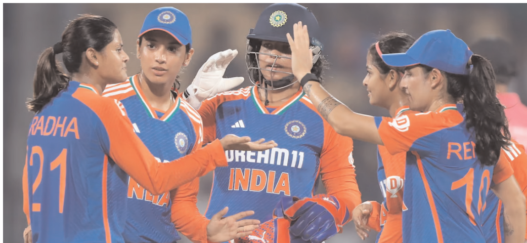
బలగం టీవీ, దుబాయ్

మహిళల టీ20 ప్రపంచకప్ సన్నాహాల్లో ఇప్పటికే వెస్టిండీస్ పై విజయం సాధించిన టీమ్ ఇండియా. తాజాగా దక్షిణాఫ్రికాపై కూడా గెలిచింది. 28 పరుగుల తేడాతో భారత్ విజయం సాధించింది. తొలుత రీచాఘోష్(36), దీప్తిశర్మ(35 నాటోటి), రోడ్రిగ్స్(30) రాణించడంతో టీమ్ ఇండియా నిర్ణీత 20 ఓవర్లలో 144/7 స్కోరు చేసింది. ఓ.పెనర్