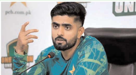
బలగం టీవీ, న్యూఢిల్లీ

పాకిస్తాన్ స్టార్ ఫ్లేయర్ బాబర్ అజామ్ సంచలన నిర్ణయం తీసుకున్నాడు. ఇప్పటికే టెస్టు ఫార్మాట్ కెప్టెన్స్ కి గుడ్ బై చెప్పిన బాబర్ తాజాగా వన్డే, టీ20 నాయకత్వ బాధ్యతల నుంచి కూడా తప్పుకున్నాడు. తన నిర్ణయాన్ని పాకిస్తాన్ క్రికెట్ బోర్డుకు కూడా తెలిపినట్లు చెప్పాడు. పాకిస్తాన్ కు కెప్టెన్ గా వ్యవహరించే అవకాశం దక్కడం తనకు ఎంతో గౌరవం అని అన్నాడు. ఈ మేరకు సోషల్ మీడియాలో పోస్ట్ చేశాడు.