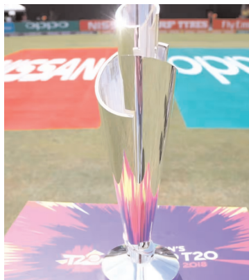
బలగం టీవీ, హైదరాబాద్

పాట్టి కప్ కోసం తలపడనున్న 10 జట్లు మొదటి టైటిల్ సన్నదమైన భారత్