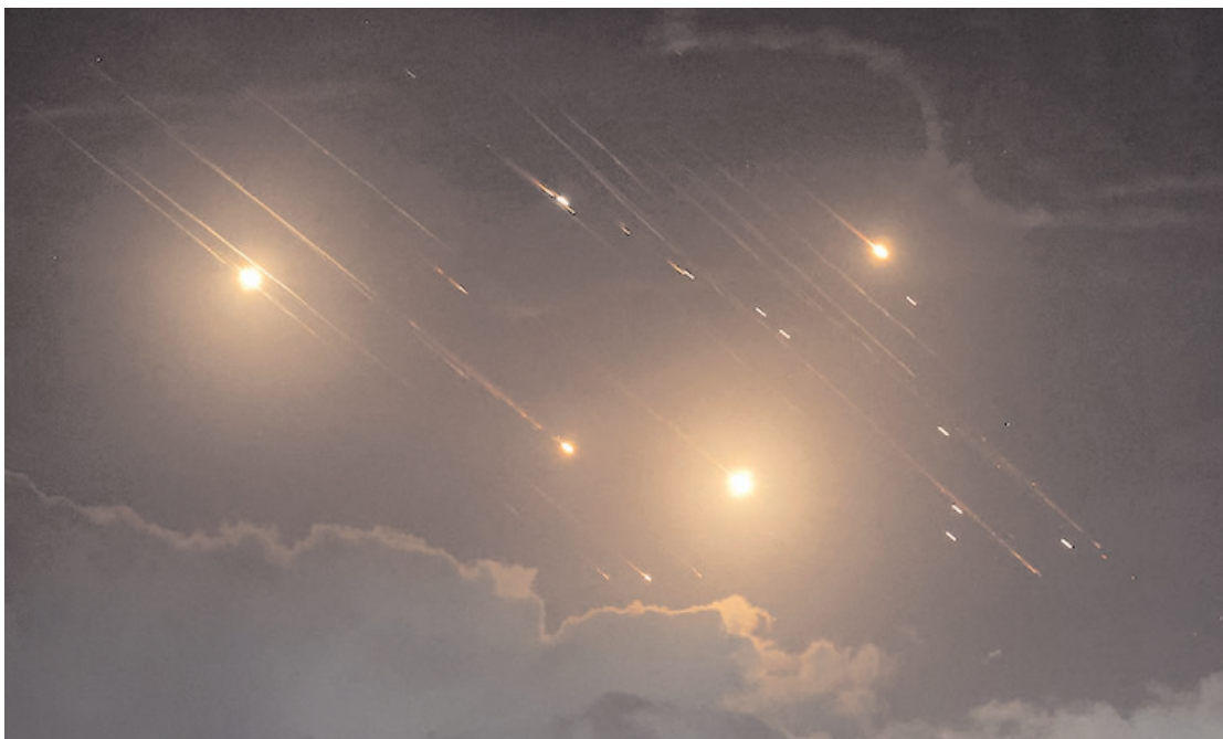
బలగం టీవీ, హైదరాబాద్ బ్యూరో

పశ్చిమాసియాలో ఉద్రిక్తతలు మరింత ముదిరాయి. ఇజ్రాయెల్-హమాస్, హెజ్బొల్లా మధ్య జరుగుతున్న యుద్ధంలో ఇప్పుడు ఇరాన్ కూడా ప్రత్యక్షంగా దిగింది. మంగళవారం సుమారు 500 క్షిపణులు, రాకెట్లతో ఇజ్రాయెల్ పై విరుచుకుపడింది. దీంతో టెల్ అవీవ్ బాంబుల మోతతో దగ్ధమైంది. పలు భవనాలు, వ్యాపార సంస్థలు దెబ్బతిన్నాయి. పౌరులు సురక్షిత ప్రాంతాల్లో ఉండాలని ఇజ్రాయెల్ హెచ్చరికలు జారీ చేసింది. వేలాది మందిని బాంబు షెల్లర్లకు తరలించింది. దాడులను అడ్డుకోవడానికి తన రక్షణ వ్యవస్థను సిద్ధం చేసింది. లెబనాన్ లో హెజ్బొల్లా నేతల మరణాలకు ప్రతీకారంగా ఇరాన్ ఈ దాడులకు దిగింది. ఇరాన్ దాడులను ఇజ్రాయెల్ డిఫెన్స్ ఫోర్సెస్ (ఐడీఎఫ్) కూడా ఎక్స్ పో నిర్ధారించింది. ఇరాన్ దాడుల నేపథ్యంలో ఇజ్రాయెల్ సెక్యూరిటీ క్యాబినెట్ సాయంత్రం అత్యవసరంగా సమావేశమై పరిస్థితులపై చర్చించింది. ఏడాది కాలంలో సెక్యూరిటీ క్యాబినెట్ ఇలా సమావేశం