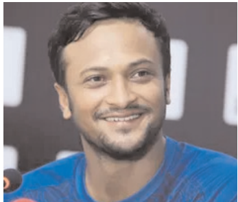
37 ఏళ్ల షకీబ్ 129 టీ20లు ఆడారు. టీ20 వరల్డ్ కప్ సమయంలోనే చివరి టీ20

ఐలగం టీవి, కాన్పూర్ బంగాదేశ్ స్టార్ ఆల్ రౌండ్ షకీబ్ అల్ హాసన్ సంచలన నిర్ణయం తీసుకున్నాడు. టీ20 పార్నాల్కు వీడ్కోలు పలుకుతున్నట్లు గురువారం ప్రకటించాడు. అలాగే తన టెస్టు కెరీర్ ముగింపు దశకు చేరుకుందంటూ వెల్లడించాడు. స్వదేశంలో మీర్పూర్లో చివరి టెస్టు ఆడాలన్న కోరికను క్రికెట్ బోర్డుకు చెప్పానని, వాళ్లు అంగీకరిం చారని, బంగాదేశ్ శకు వెళ్లేందుకు ఏర్పాట్లు చేస్తున్నారని, ఒకవేళ అలా జరగకుంటే, కాన్పూర్లో భారత్తో జరిగే టెస్టు తనకు చివరిదని తెలిపారు.