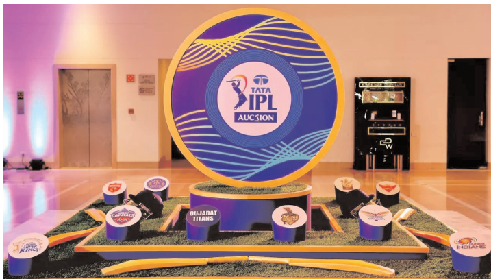
ఐలగం టీవి, బెంగళూరు

ఐపీఎల్ 2025 మెగా వేలానికి సంబంధించిన రిటెన్షన్ పాలసీని బీసీసీఐ ఖరారు చేసినట్లు సమాచారం. బెంగళూరు వేదికగా జరిగిన బీసీసీఐ 93వ సాధారణ సర్వసభ్య సమావేశం(ఎజీఎం) జరిగింది. ఈ మేరకు అతి త్వరలోనే బీసీసీఐ ఐపీఎల్ 2025 రిటెన్షన్ పాలసీని అధికారికంగా ప్రకటించనుంది.