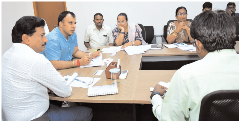
బలగం డీపీ, సిరిసిల్ల రాజన్న సిరిసిల్ల జిల్లాలోని