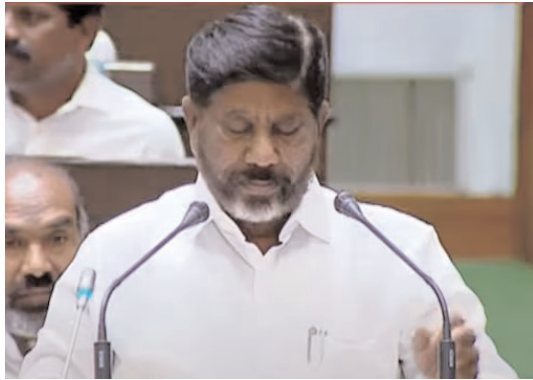
వినిమయ బిల్లును సభలో ప్రవేశపెట్టనున్నారు. అలాగే ఆగస్టు 1, 2 తేదీల్లోనూ రేవెన్యూ సర్కారు వివిధ బిల్లులు ప్రవేశపెట్టేందుకు కనరత్తులు చేస్తోందని సమాచారం

బలగం టీవీ, హైదరాబాద్ బ్యూరో తెలంగాణ శాసనసభ సమావేశాలు జూలై 23న ప్రారంభమైన విషయం తెలిసిందే. ఈ అసెంబ్లీ సమావేశాలు ఆగస్టు 2 వరకు కొనసాగుతున్నాయి. గురువారం (జూలై 25) డిప్యూటీ సీఎం, ఆర్థిక మంత్రి ముఖ్య భట్టి విక్రమార్క అసెంబ్లీలో బడ్జెట్ ప్రవేశపెట్టనున్నారు. శాసనమండలిలో మంత్రి శ్రీధర్ బాబు బడ్జెట్ ప్రవేశపెడతారు. జూలై 26వ తేదీ అసెంబ్లీకి సెలవు ప్రకటించారు. జూలై 27న బడ్జెట్ పై చర్చ చేపట్టనున్నారు. జూలై 28న ఆదివారం కావడంతో అసెంబ్లీ సమావేశాలు తిరిగి సోమవారం నుంచి కొనసాగుతున్నాయి. జూలై 29, 30 తేదీల్లో పలు బిల్లులను కాంగ్రెస్ ప్రభుత్వం ప్రవేశపెట్టనుంది. జూలై 31న ద్రవ్య